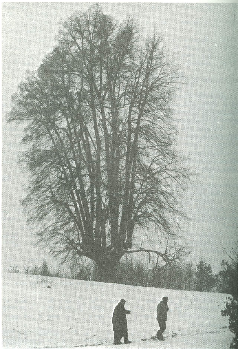
Lepotica med lipami