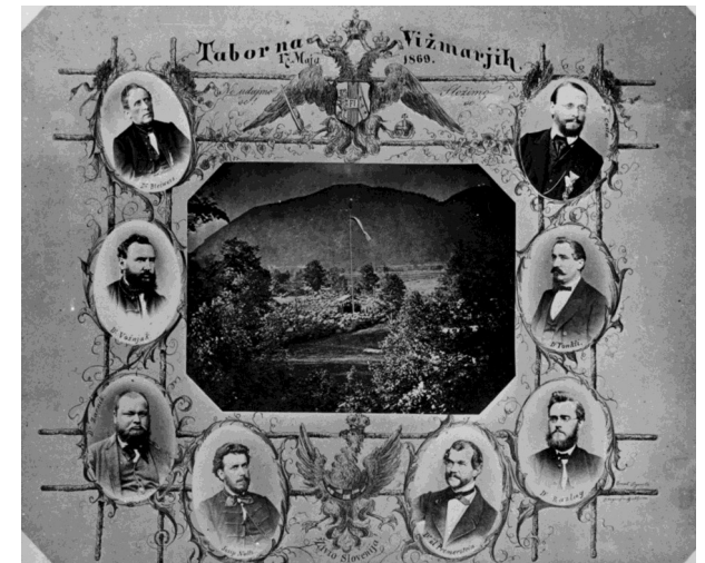
Fotografija tabora v Vižmarjih. SN 1869, št. 53

Čitalnice so omogočile naslednji korak - Slovensko taborsko gibanje, ki je v takratnem obdobju pomenilo višek slovenskega narodnega združevanja in enotnega nastopanja v skupnih zahtevah, pomembno pa je budilo narodno zavest tudi med preprostimi ljudstvom.