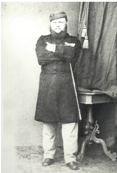
Valentin Zarnik.