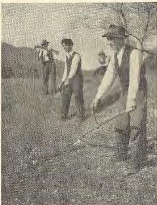
Ce glih prav lop' cveti in prav tajn diši, zvečer suha tam leži

na domu vsega dovolj: dela, še bolj pa hrane, ko so stare kmečke kašte še služile stoletja staremu namenu za shrambo žita, mesnine in zabele, ko je po kmetijah vladalo zadovoljstvo in božji blagoslov, takrat je v kraju, ko se je začela košnja, kar odmevalo v petju. Četudi je bil počitek prav kratko odmerjen v kratkih poletnih nočeh, je vendar novo in mlado poletno jutro prineslo vedno novega veselega življenja v zgodnje ure, ki je ni oznanjala nobena oglušujoče trobljena sirena s točno minutno napovedanim začetnim delom. Včasih prej, včasih bolj pozno je nastopil 16 urni in tudi 18 urni kmečki delovni dan, saj pravi naša pesem: