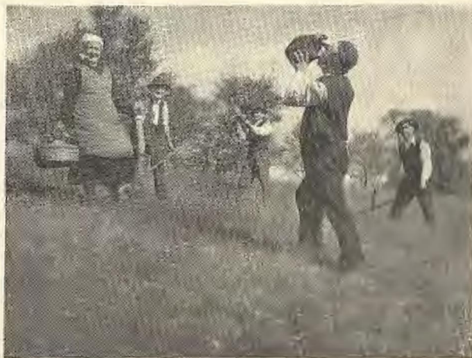
Kakor se koscu strleže, tak mu koasa rteže

Domača dekla je prinesla koscem zajtrk ter ga postavila in pripravila na primernem prostoru. Če je bilo dosti koscev, sta prinesli zajtrk dve, eno skledo štrukeljnov ali nudeljnov, ki so kar plavali v zabeli, ter velik lonec krompirjeve ali — kakor pri nas pravimo — riepne župe, da so si kosci dušo privezali za nadaljnje delo. Jerbas je poveznila na tla, nanj pa »na-