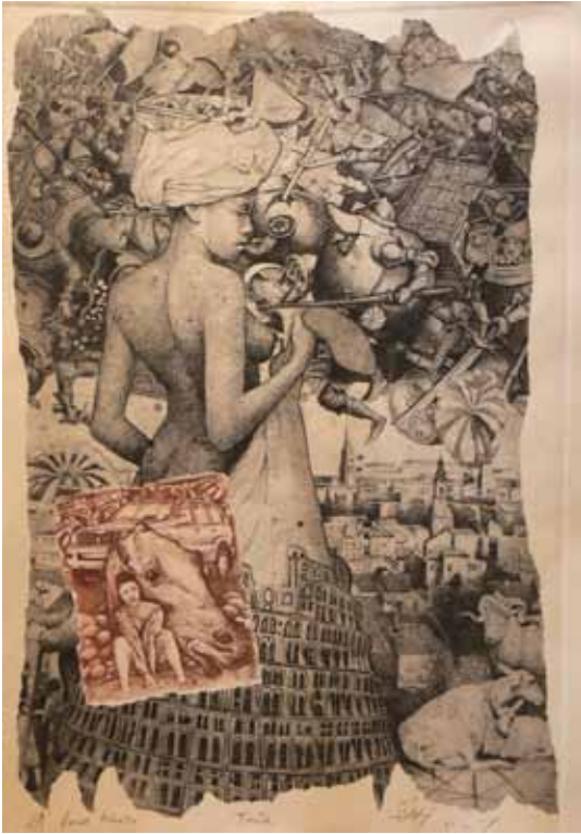
Bez naslova mešana tehnika