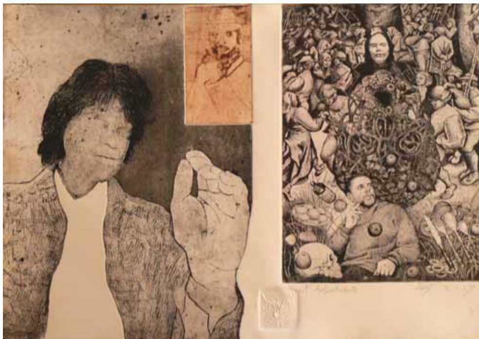
Bez naslova mešana tehnika