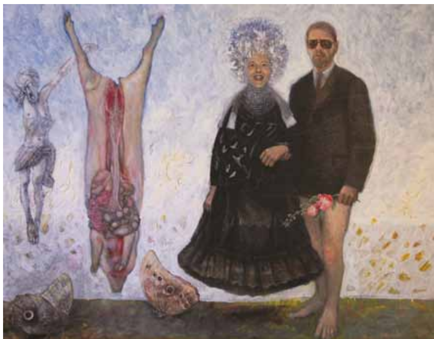
Nešto kao venčanje 78x59cm, olje na platnu, 2008