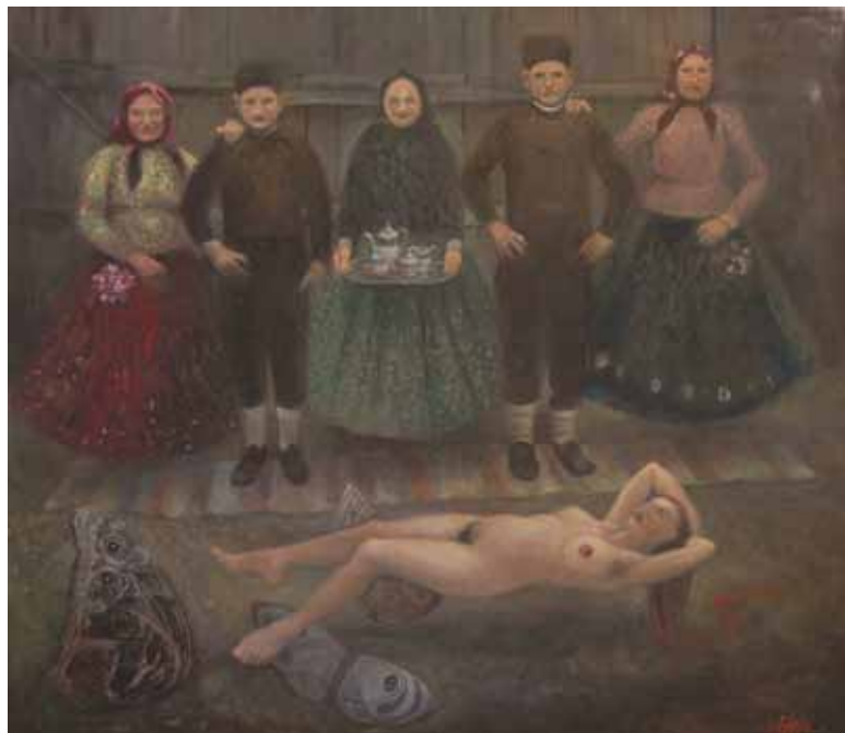
Padinsko čudo 69x59cm, olje na platnu, 2005