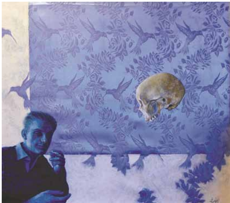
Albin, dialog 77x77cm, mešana tehnika, 2011