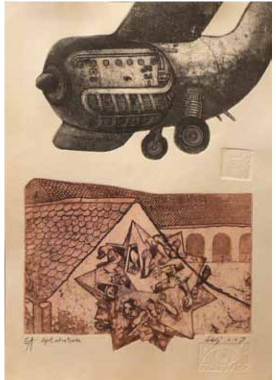
Bez naslova mešana tehnika