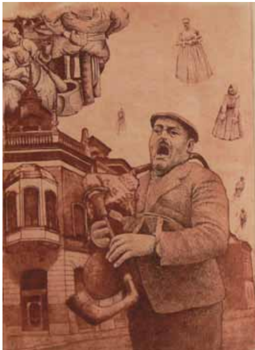
Dva dudu, otac i Modigliani 54x60cm, olje na platnu, 2011