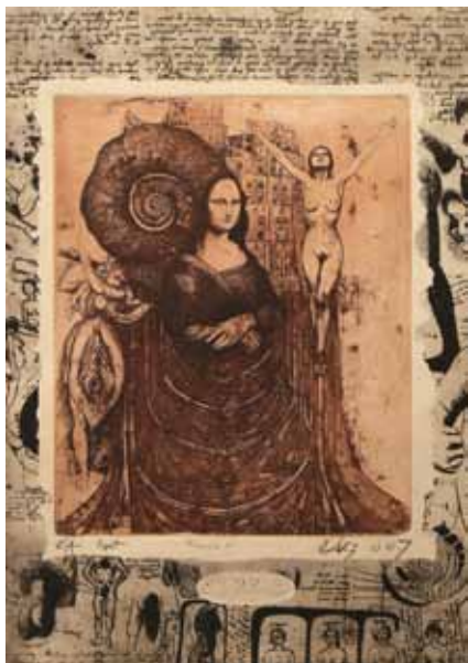
Bez naslova mešana tehnika