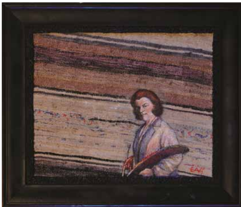
Zuzka Medvedova 50x40cm, mešana tehnika, 2011