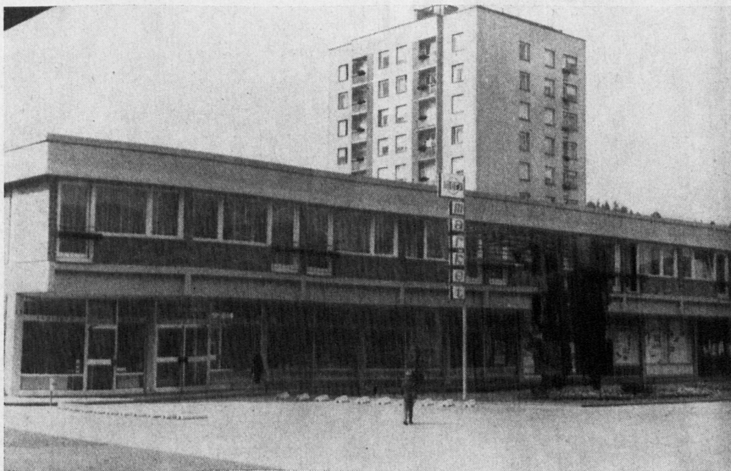
Brez samopostrežne trgovine zdaj že ne bi mogli več biti

Posebno se zahvaljujem sindikalni podružnici Železarne Ravne za pomoč. Prisrčna hvala tudi njegovim sodelavcem za tople poslovilne besede, ki so orisale njegovo življenjsko pot in počastile njegov spomin. Žaluojača žena Lojzka