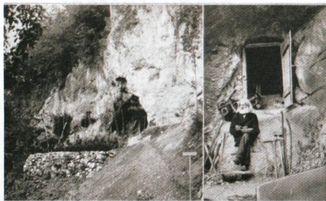
Vhod v poseljski grad