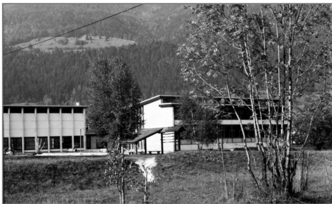
Osnovna šola 16. december v Mojstrani leta 1982