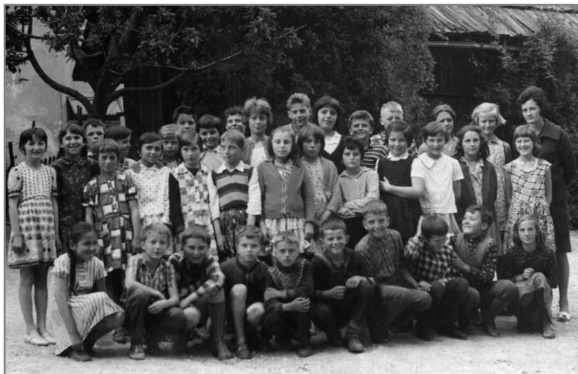
Učenci četrtega razreda šole na Dovjem v šolskem letu 1962-63

boljše in okusnejše jedi. Pogrešala pa sem sprehode na Dovje. A organizirali so nam pohode na Mežaklo, k slapu Peričniku, v Vrata, Zgornjo Radovno in k spomeniku nad Sedučnikom. Spominjam se še šolskih izletov v Begunje in k spomeniku v Dragi, v bolnico Franjo, Postojno in Postojnsko jamo, v Ljubljano, le na Jesenice nismo šli. Tudi Vrba s Prešernovo rojstno hišo je bila vredna našega ogleda. Prav poseben pa je bil končni izlet v osmem razredu, ko smo šli skupaj s šestim in sedmim razredom na dvodnevni potep na Plitvička jezera in preko Velebita v Crikvenico. Takrat sem prvokrat videla morje, v Crikvenico pa sem še v zrelih letih hodila na poletni dopust.