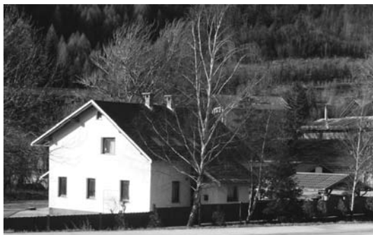
Pred leti prenovljena Smrekarjeva hiša.

Težko je bilo razumeti, da izgubljam sosede. Le-ti so se preselili na Koroško Belo in na Plavž. Ostali so nam sosedje »za 8 ur«. To so bili delavci gradbenega vzdrževanja. Zaradi varnosti železarne so nam postavili vratarja pri kavperjih in pri Hermanu. Po pripovedovanju starejših od nekdanje najlepše ulice na Jesenicah ni ostalo nič. Postali smo izolirani od mesta. V tem času je bilo tudi veliko tatvin, zato smo bili stalno kontrolirani. Rezanje električnega kabla, pobiranje vodovodnih cevi – posledica je bila, da smo bili večkrat brez elektrike in vode. Kontrola se je dogajala