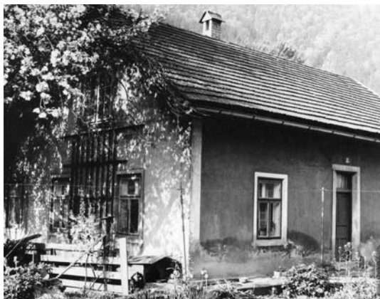
Smrekarjeva hiša leta 1968. (M. Smrekar)

prahu. Stanovalci smo bili različne narodnosti, razumevanje pa dobro. S pričetkom gradnje aglomeracije se je nadaljevalo rušenje pražilne, rak, apnenice,