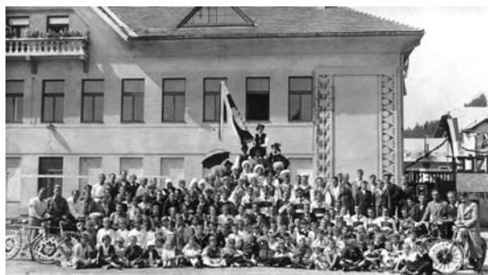
Člani Krekovega društva leta 1929 ali 1930.

Na drugi strani dvorane nad gostinskimi prostori so uredili ljudsko kuhinjo. Vodile so jo častite sestre reda »De notre Dammes« - francoski red. V kuhinji je bila vodja sestra Notburga. V kuhinji so se odvijali kuharski tečaji, kjer so odrasla dekleta kuhala in delala slaščice kot v gospodinjski šoli. Izvrstne so bile kremne rezine (kremšnite) in