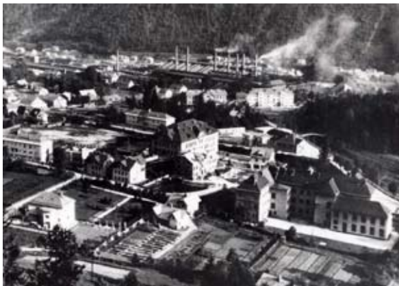
Pogled na Savo s Krekovim domom v sredini okoli leta 1938.