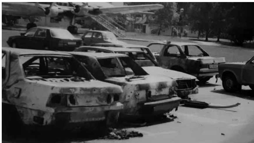
Zgoreli avtomobili na Brniku.

Malo pred deseto uro je kolega zaslišal letala. Odšel je pogledat in iz smeri vzhoda opazil dve letali, ki sta se bližali Brniku. Prepričani smo bili, da gre za podobne manevre kot prejšnji dan, takrat pa je kolega zavpil, da sta nekaj odvrgli. Letali sta izstrelili vsaka po dve raketi. Še preden smo se zavedali, kaj se dogaja, so nas presenetili močan pok, tresenje in grmenje. Prva raketa je zadela oskrbovalni center Adrie Airways, tik poleg naše zgradbe. Sunek je bil zelo močan, šipe so se razletele na vse strani, vse, kar je stalo, je padlo po tleh. Po železnih stopnicah so padala priznanja, obešena na stenah hodnika. Vse se je treslo in grozljivega hrušča ni in ni hotelo biti konec. Kot smo videli kasneje, sta drugi dve raketi prileteli na parkirni prostor med parkirana vozila, četrta raketa pa je zadela hangar Adrie Airways. Občutek sem imel, kot da je sodni dan.