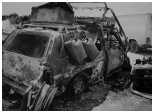
Vozilo avstrijskih novinarjev, ubitih ob raketiranju Brnika.

Popoldne je bilo znova slišati strele v bližini brniškega letališča. Po neuradnih vesteh je bil na južni strani letališča ubit en avstrijski novinar, po drugih virih pa dva.« 13 Zgolj hladna dejstva, ob katerih so strahovi udeležencev, ki so raketiranje preživeli v hangarju, odšli v pozabo!