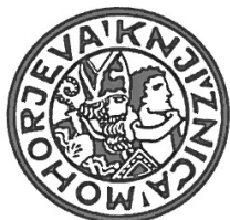
1929: Mohorjeva knjižnica 1929 (tudi 1949)