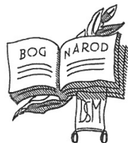
1928 (autor: Boris Kobe): osnutek