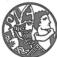
1937: Studenci žive vode I (S. Cajnar, Luč sveti v temi); Mohorjevi koledarji po letu 1946