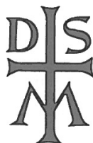
1938: Cvetje iz domačih in tujih logov

Nekateri logotipi, ki so bili natisnjeni v knjigah DSM pred drugo svetovno vojno