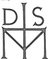
1937: Cvetje iz domačih in tujih logov; Književni glasnik MD 1939