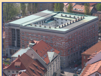
La Biblioteca universitaria nazionale (NUK)

4. Il gigante dell'architettura Jože Plečnik ha colto le radici dell'arte e ha dato loro delle ali internazionali.