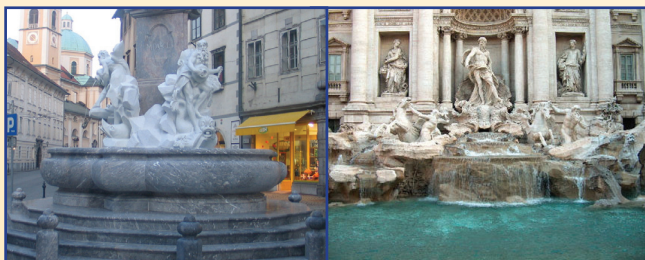
Robba (3 fiumi)

2. L'acqua delle fontane della capitale slovena (Lubiana) e quella italiana (Roma) finisce nello stesso mare.