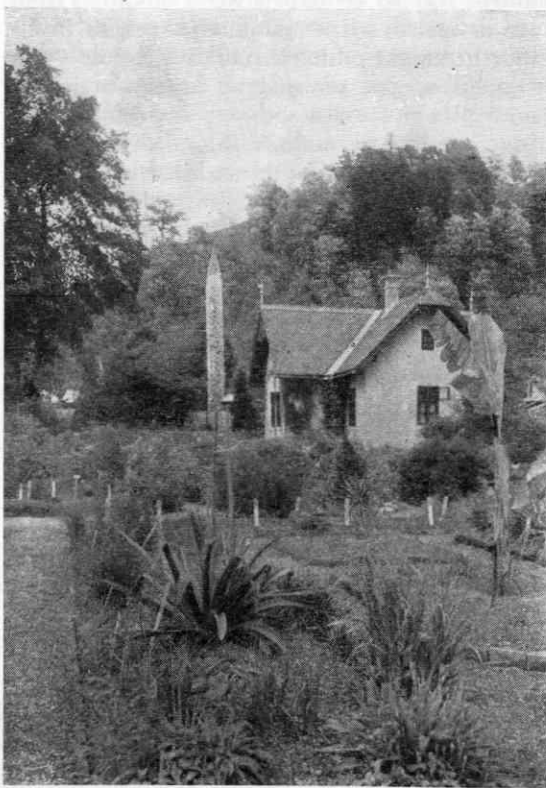
Upravno poslopje botaničnega vrta

Iz vsega tega moremo sklepati, da botanični vrt v tem času ni bil tako slabo urejevan, kot bi se zdelo na prvi pogled. Še vedno lebdi nad njim Hladnikov genij;