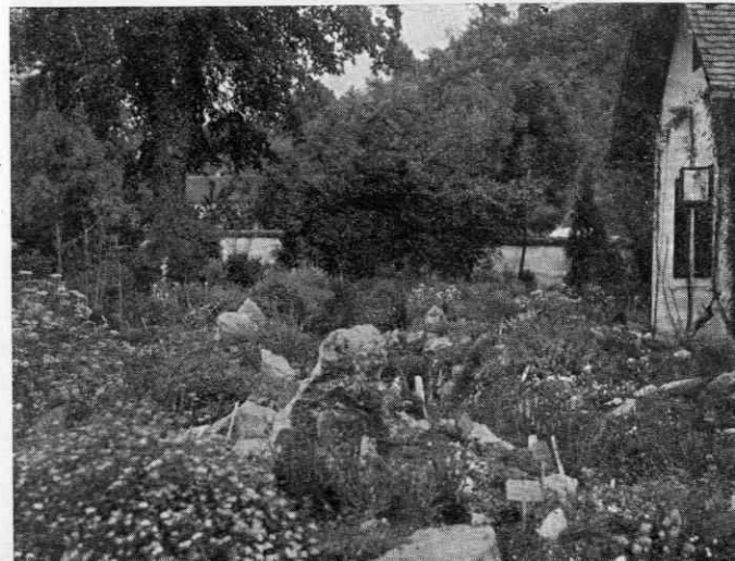
Nasadi botaničnega vrta