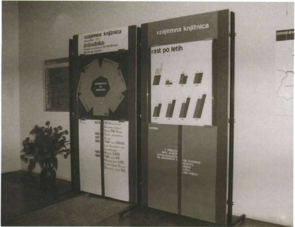
Razstava Vzajemna knjižnice ob 35 – letnici Mariborske knjižnice.