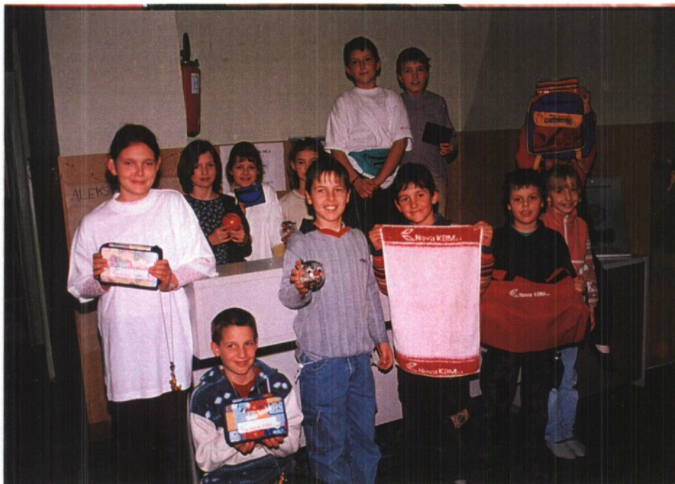
Fotografija 4: Varčevalci naše šole s praktičnimi nagradami, ki so si jih prislužili