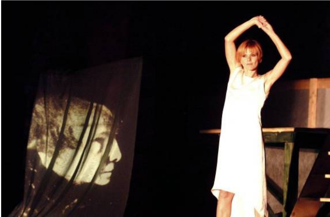
Slika 19: Alma ali angel na zemlji – avtorski projekt