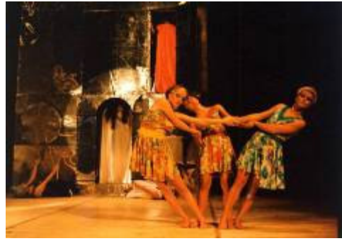
Slika 10: Slovenska rapsodija