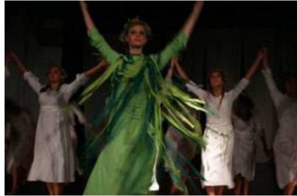
Sliki 14 in 15: Tris (praznovanje pomladi v treh slikah) (vir: zasebna zbirka)