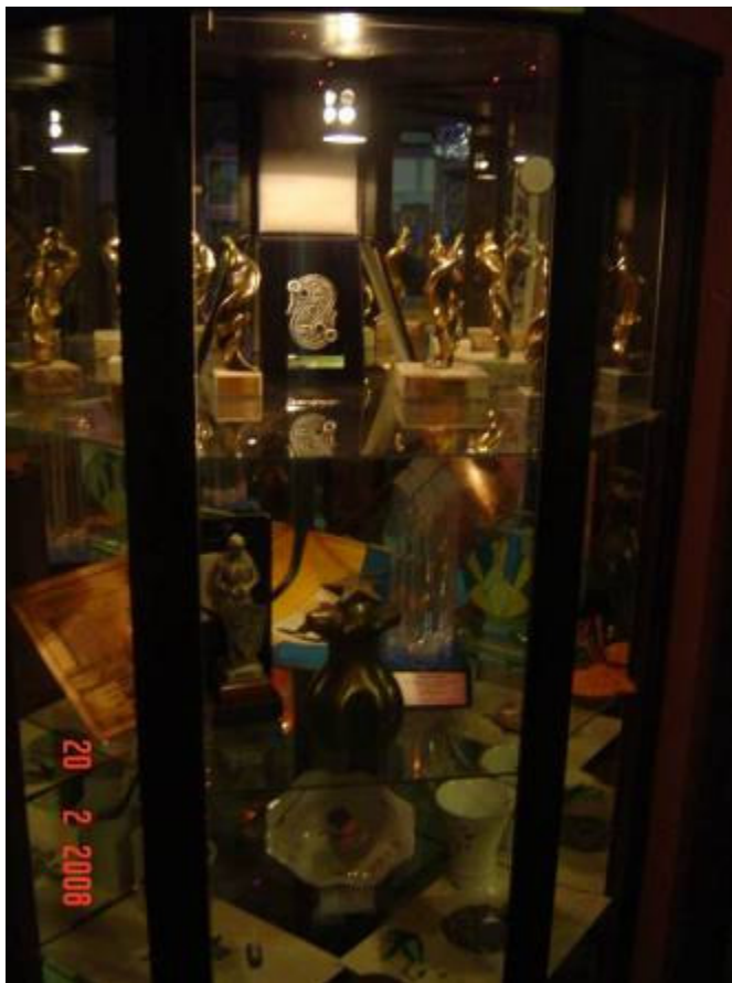
Slika 27: Nagrade Opus

Opus 1, to je edino tekmovanje za mlade na področju sodobnega plesa v Sloveniji, kjer sodoben ples ni tekmovalnega značaja. Vendar gre za prireditev za mlade, da sami ustvarjajo. Tukaj pomembno vlogo igrajo njihovi mentorji, ki jih plesno vzgajajo. Tako npr. dobijo vsako leto temo, na katero se potem predstavijo. Gordana je priznala, da odkar Opus 1 obstaja, to je že 15 let, ni bilo leta, da oni ne bi dobili nagrade.