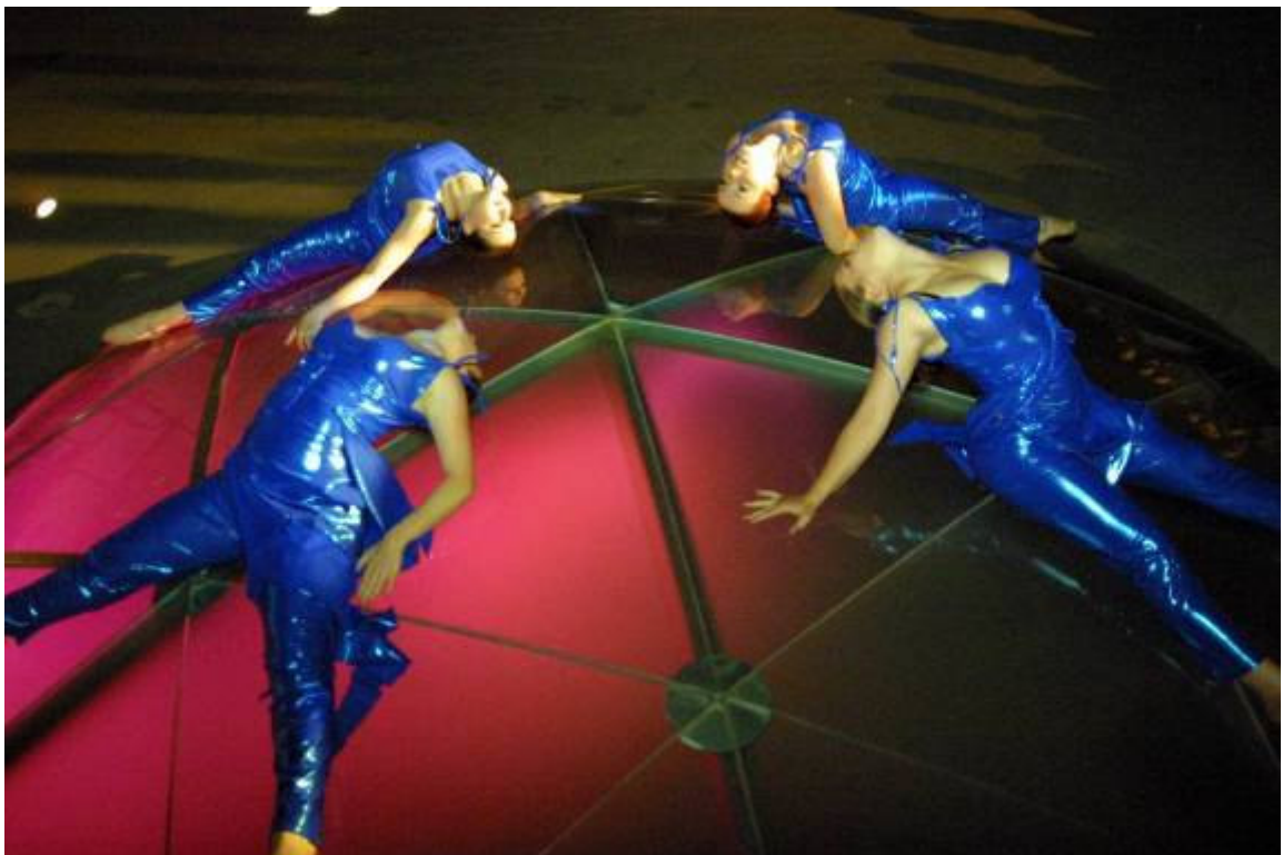
Slika 20: Bis – multimedijski ambientalni projekt