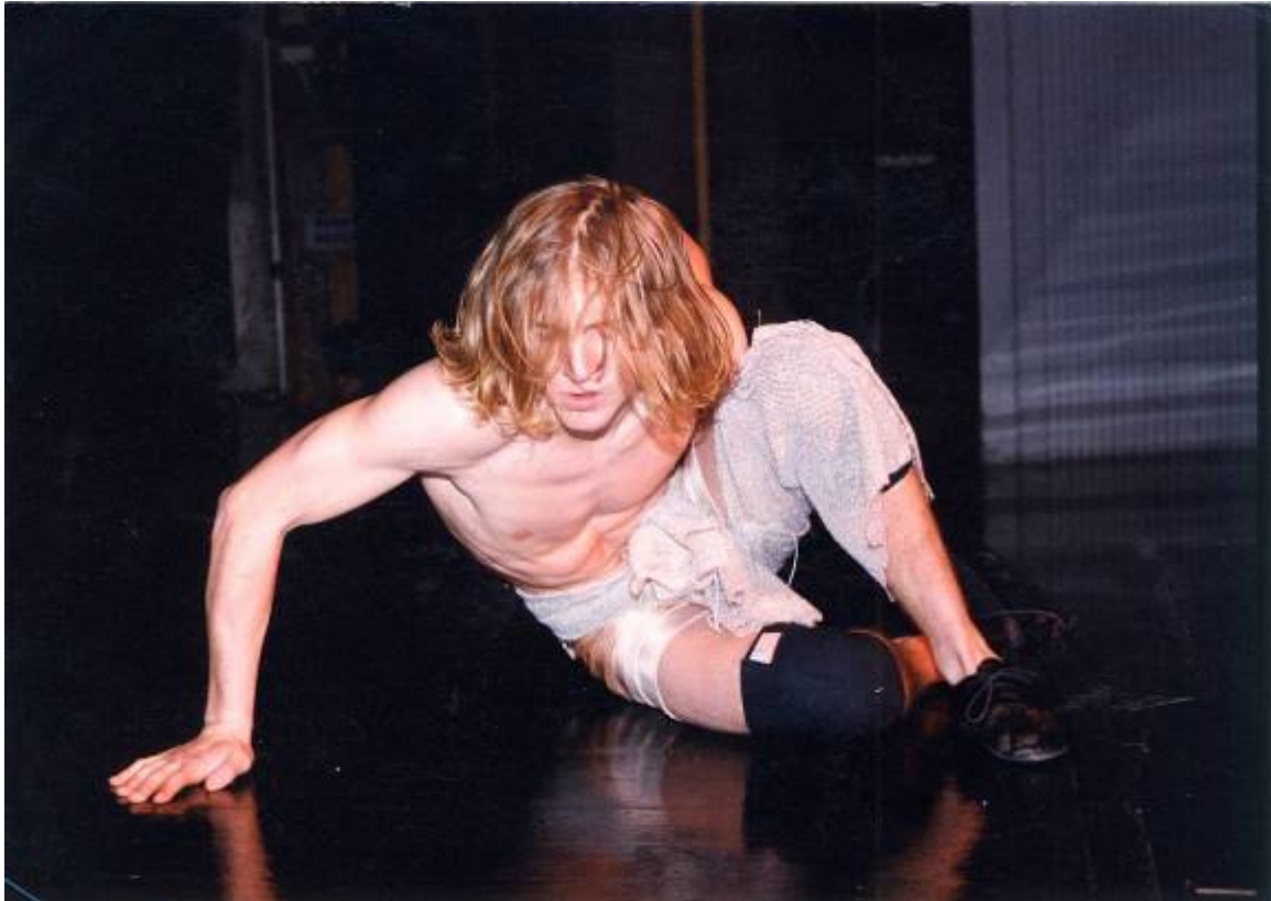
Slika 17: Zgodba o plesu – plesna predstava