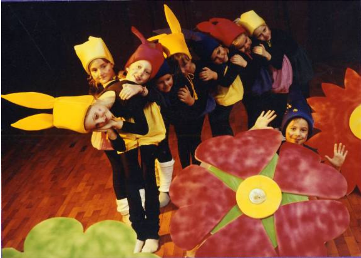
Slika 23: Škrat Sanjavec – plesna slikanica za otroke