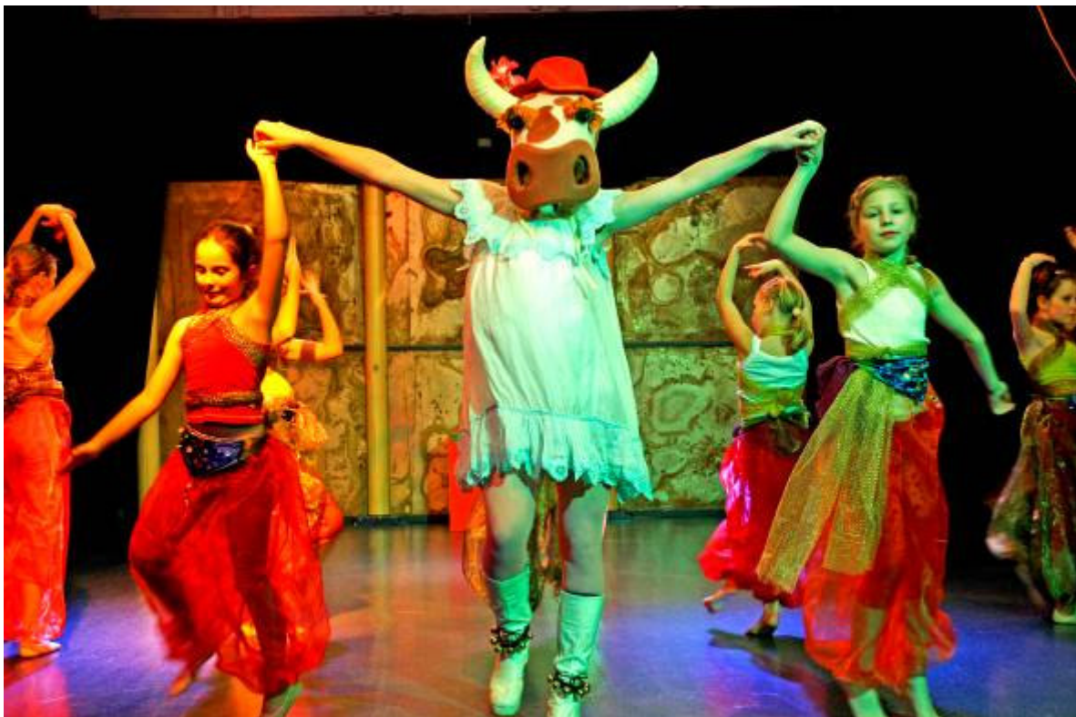
Slika 22: Krava v cirkusu – plesna humoreska za otroke