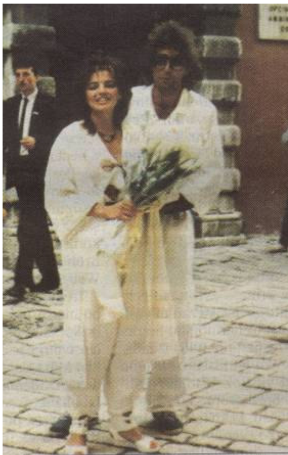
Slika 9: Rovinj, 1986. Prve minute po tem, ko sta si rekla »da«