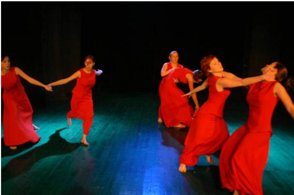
Slika 18: Večerja z demoni