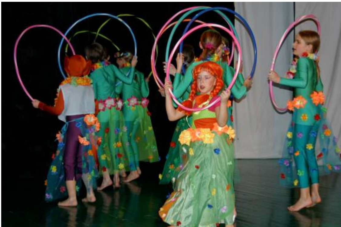
Slika 24: Vila Čira – čara