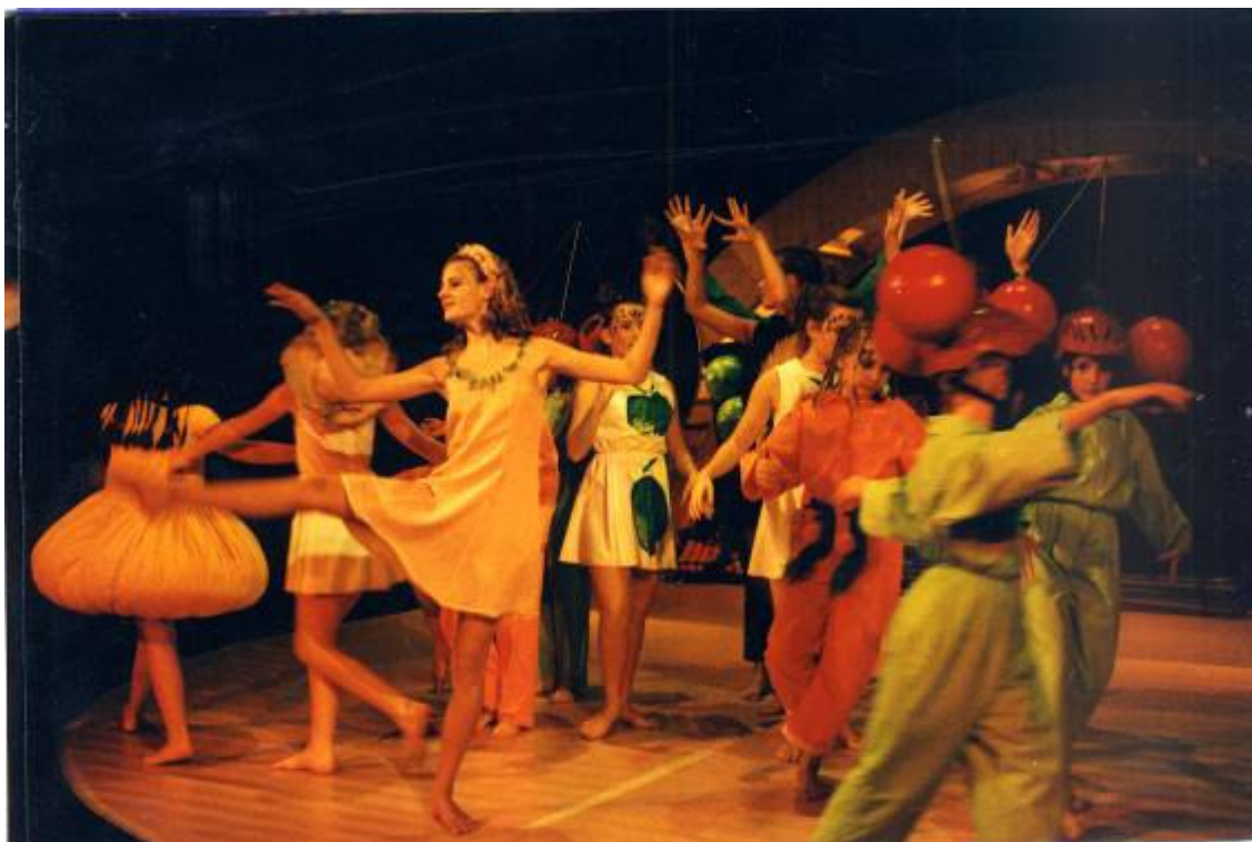
Slika 26: Sadna opera – plesno-gledališki projekt za otroke