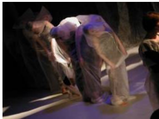
Slika 12: Mreža za metulje časa