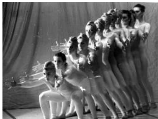
Slika 13: Metamorfoze