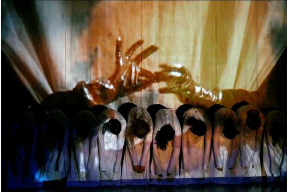
Slika 25: Hororskop