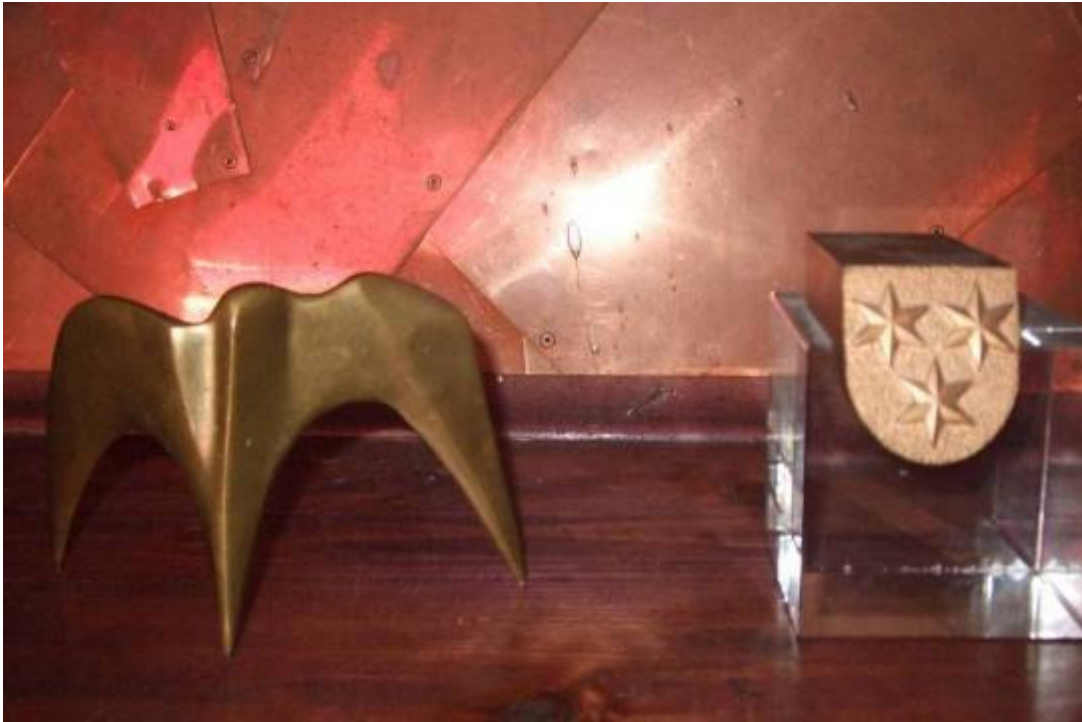
Slika 28: Zlata ptica Slovenije (1984) in Bronasti celjski grb (1997)

Večina avtorskih plesov plesalcev PFC je bila vsako leto uvrščena v sam vrh oz. med prva tri mesta tekmovanja OPUS 1.