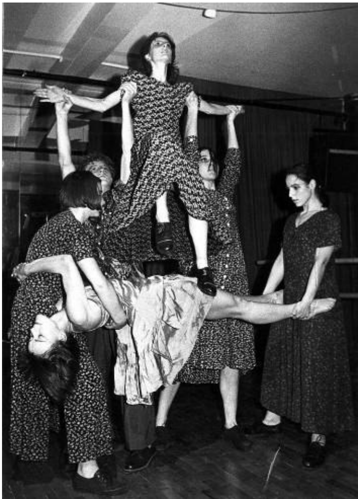
Slika 16: Plesni dogodek »7+5«

In še nekaj fotografij s teh plesnih predstav: