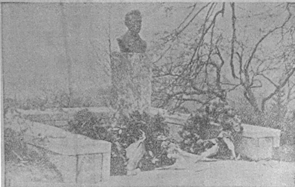
Spomenik na Cankarjevem vrhu

(K dvaintrideseti obletnici njegove smrti)