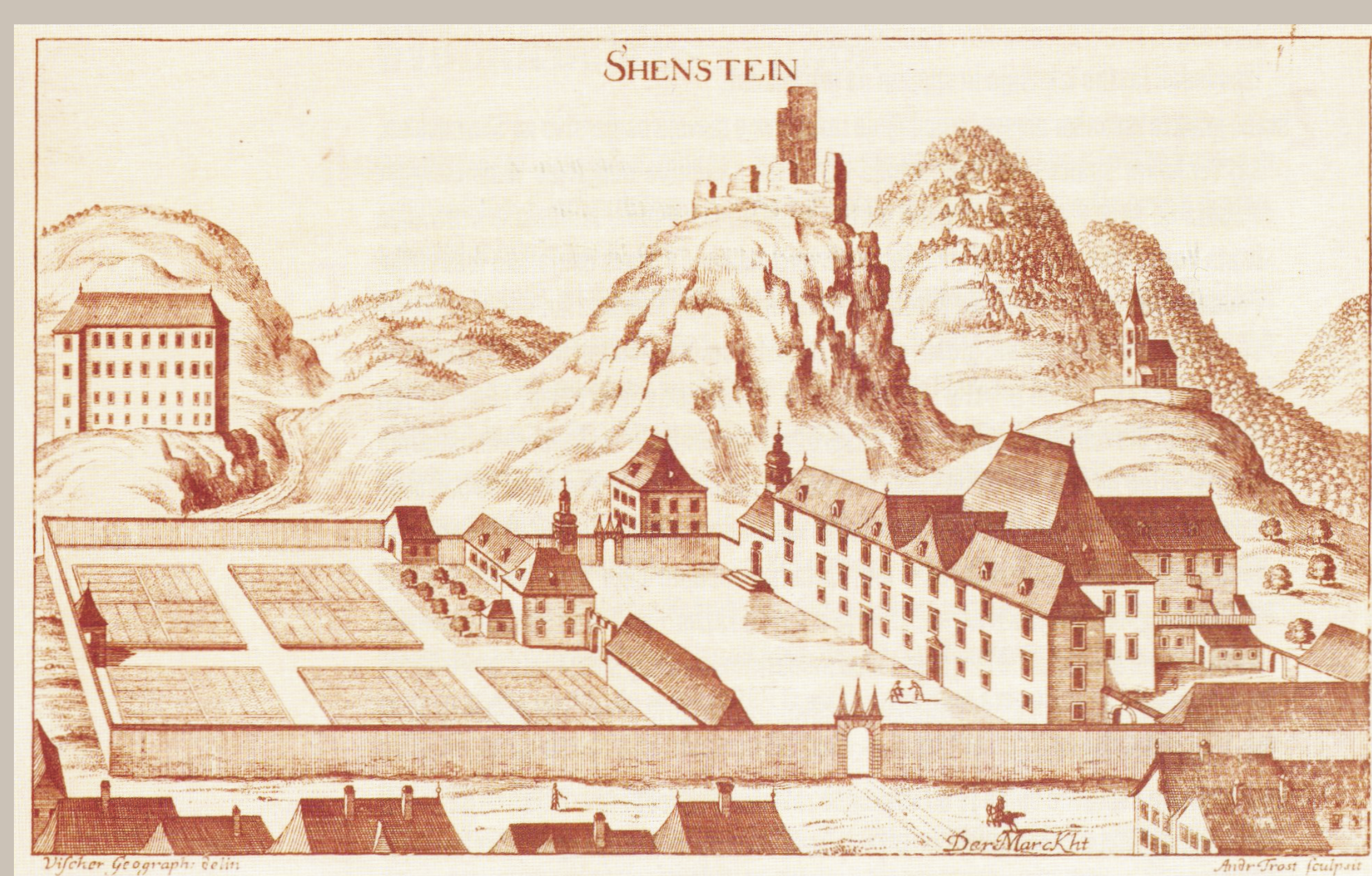
Šoštanj (Georg Matthäus Vischer: Topographia ducatus Stiriae, 1681)