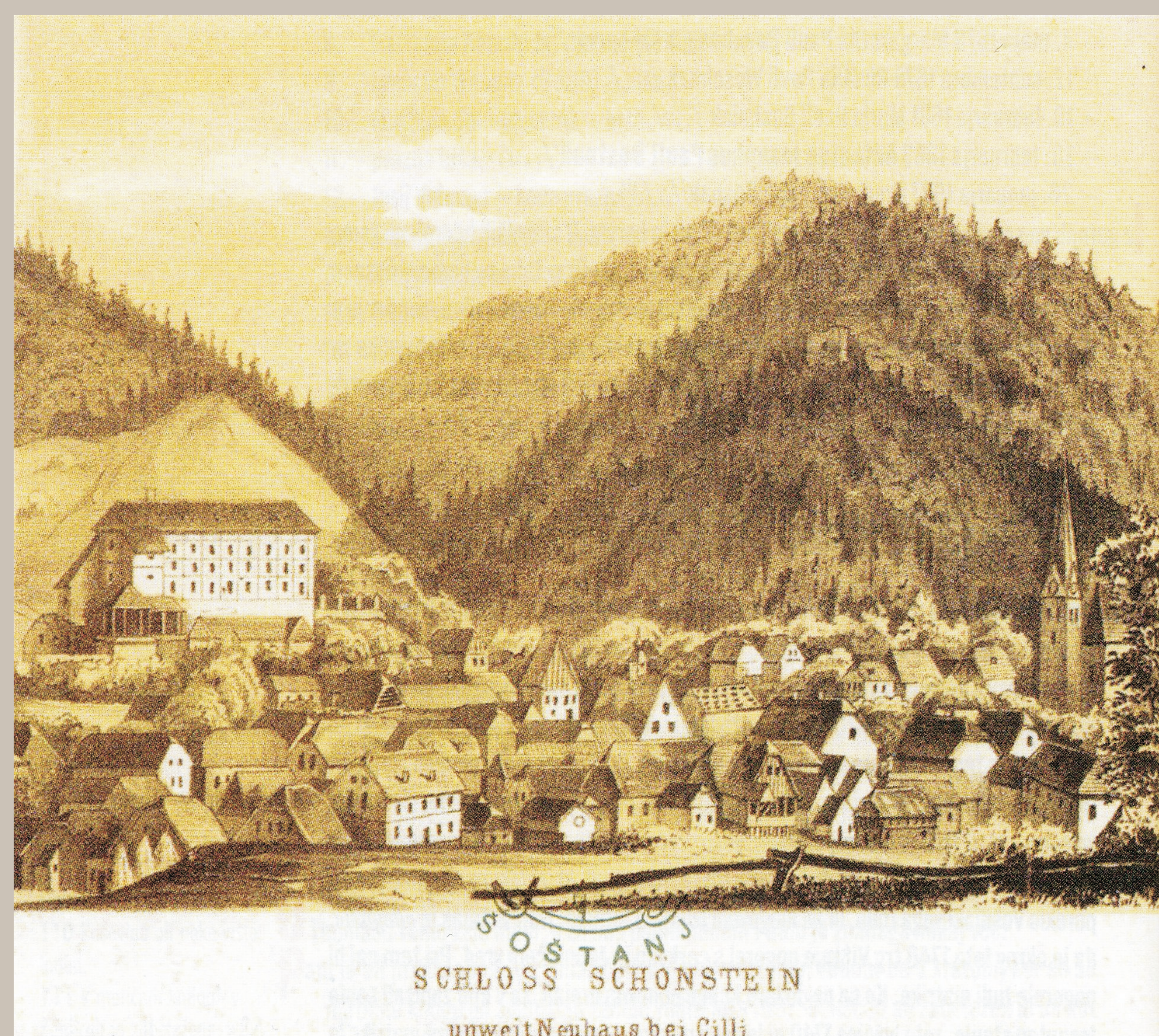
Trg Šoštanj. Kaiserjeva suita, sredina 19. stoletja

Žraven Savinjske doline je gotovo Šaleška, ki je od Savinjske ločena po nizkem hribovju, ena najlepših vsega slovenskega Štajerja. Glavni kraj te doline je prijazen trg Šoštanj, ki se na spodnjem koncu doline razprostira med Pako in vznožjem lokviških goric in tudi onstran Pake, kjer stoji pohlevni dvor železnice Celje-Velenje in se čedalje več novih hiš zida. *