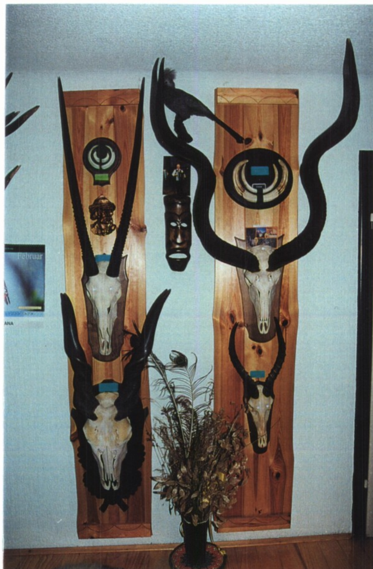
F O T O G R A F I J A L