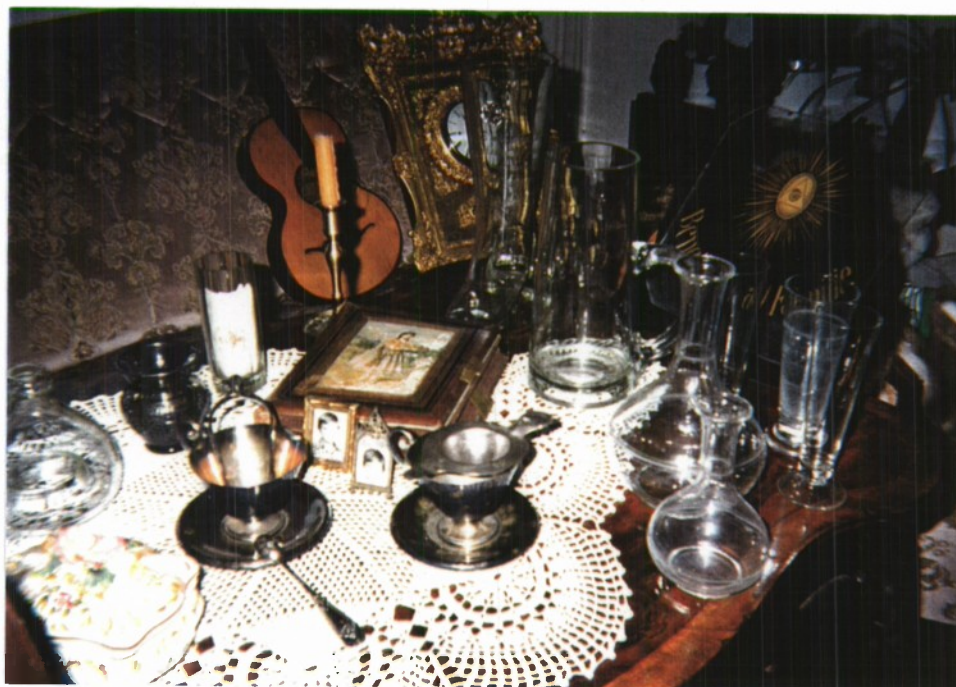
ŽBIRKA STARIN GOSPE JERICE VIVAT