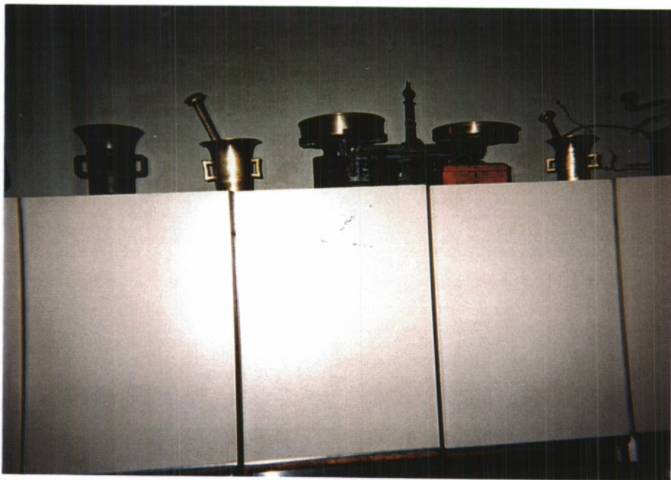
MOŽNARJI IN KUHINJSKA TEHTNICA