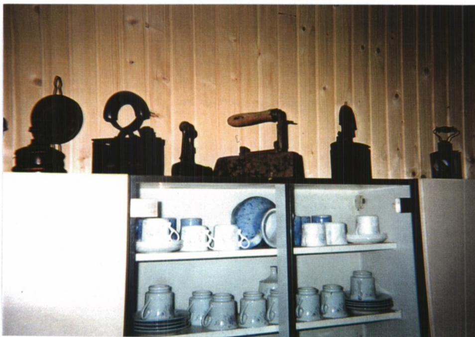
ZBIRKA STARIH LIKALNIKOV