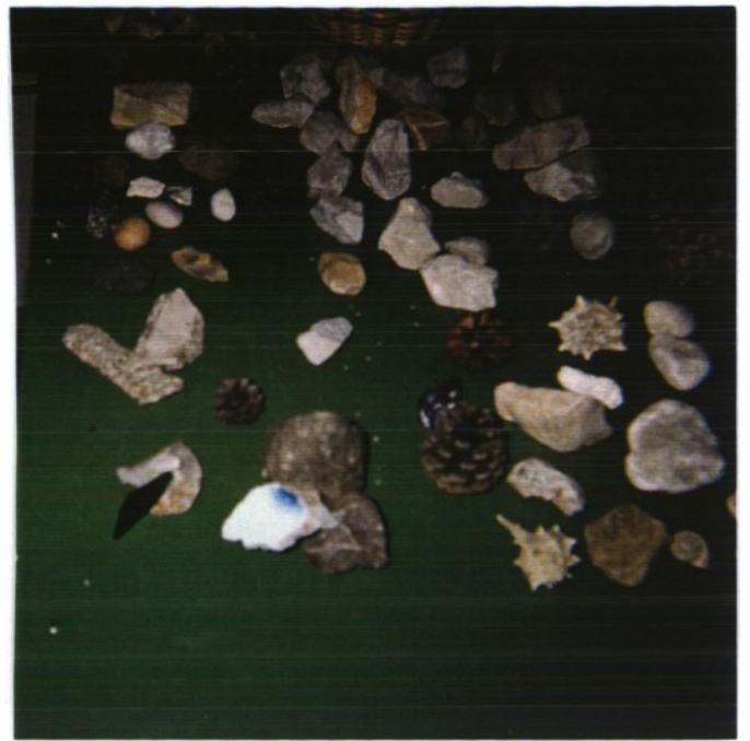
VULKANSKI KAMEN (ITALIJA)