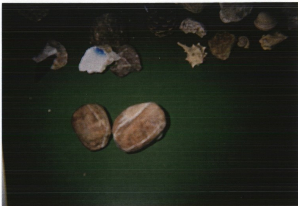
KAMNA 2 OTOKA SV. ŠTEFANA