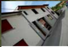
LEHTERJEVI, GULIČEVI, ČEHOVI