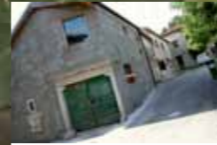
SERAŽINOVI, MAJCNOVI, CELANOVI