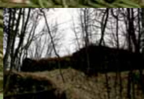
Severovzhodna stran stolpa