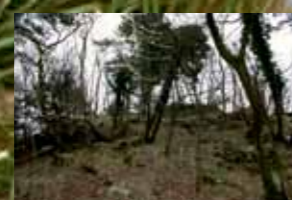
Severozahodna stran stolpa, pot na vrh