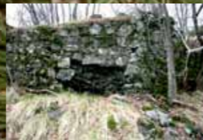
Severovzhodna stran stolpa