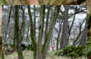
Jugozahodna stran Tabora - pogled proti Sežani

Prazgodovinsko gradišče obdaja dvojni nasip.