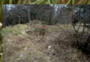
Na vrhu - pogled iz stolpa proti severovzhodu