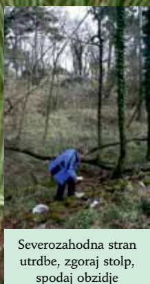
Severozahodna stran utrdbe, zgoraj stolp, spodaj obzidje