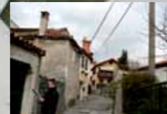
FAKUČEVI, ŠIRCETEVI, JOŽEVI