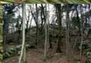
Pogled proti vrhu Tabora, severovzhodna stran, zgoraj stolp