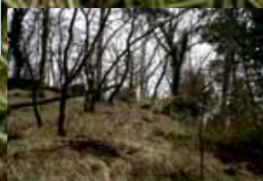
Severozahodna stran stolpa, desno ostanki obzidja utrdbe