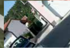
FUTOVI, kjer je živel Jože Pahor