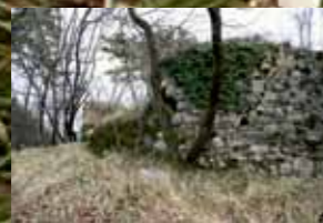
Zahodni vogal stolpa

Ruševine osrednjega stolpa srednjeveške utrdbe so bolj ohranjene, obzidje pa le delno.