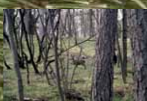
Jugovzhodna stran Tabora