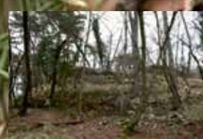
Zahodna stran obzidja, zgoraj desno ostanki stolpa

Prazgodovinsko gradišče obdaja dvojni nasip.