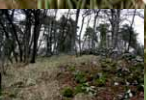
Jugozahodna stran Tabora - pogled proti vrhu