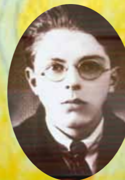
SREČKO KOSOVEL (1904-1926)

Bila je profesorica slovenskega jezika v Ljubljani.