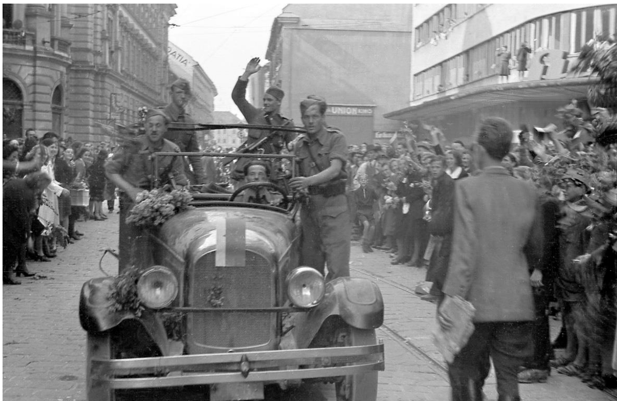
Slika 6: Prihod partizanov v Ljubljano, 9. 5. 1954

8. 9. 1943 so oznanili kapitulacijo Italije. Ljubljancani so zaman upali, da je prišel mir. Že devetega septembra so bili v Ljubljani Nemci in šele v začetku maja 1945 so jo zapustili.