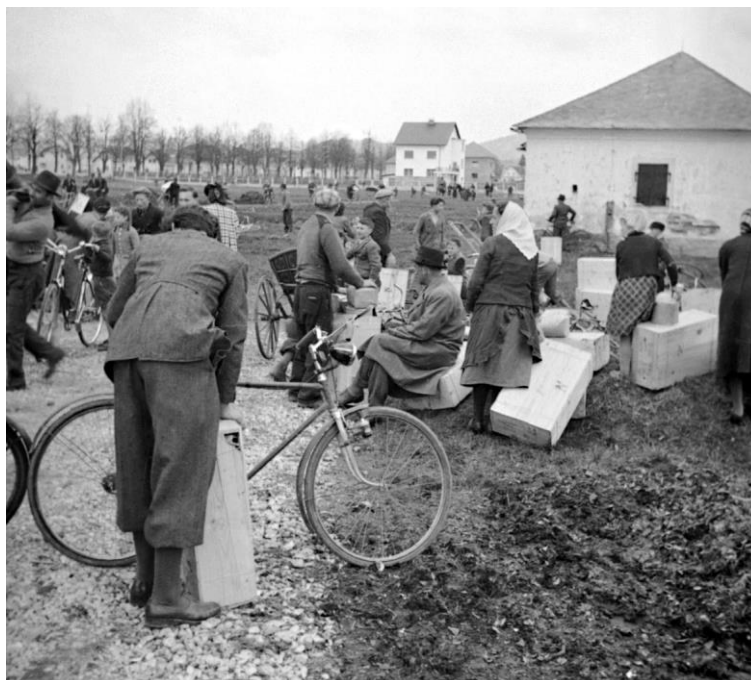
Slika 7: Plenjenje skladišča sladkorja za Bežigradom, 11. 4. 1941