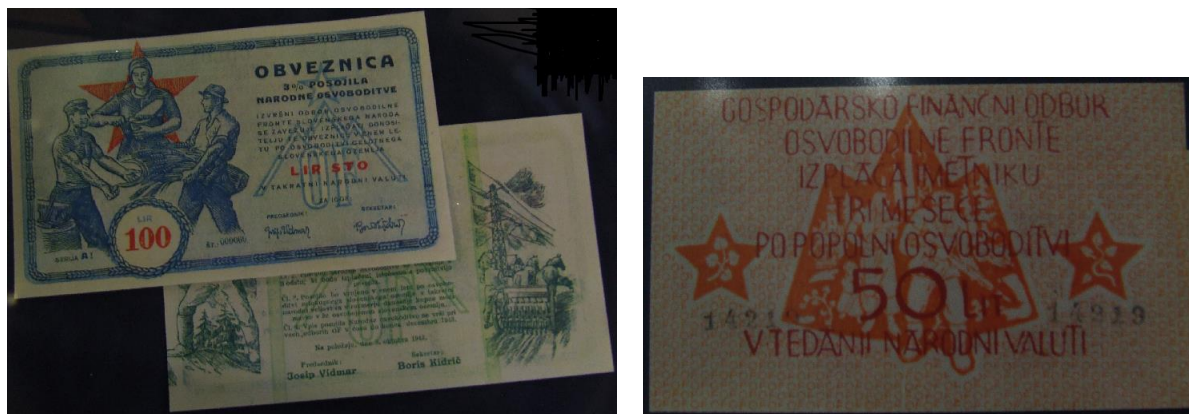
Slika 15: Obveznica in potrdilo o posojilu