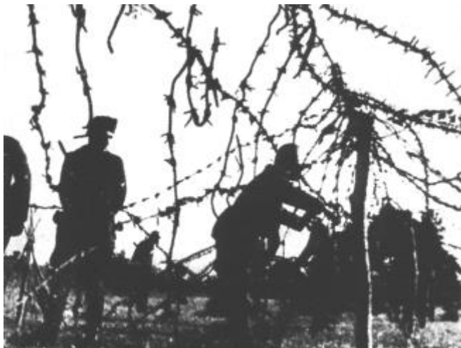
Slika 5: Postavljanje žične ograje okoli Ljubljane