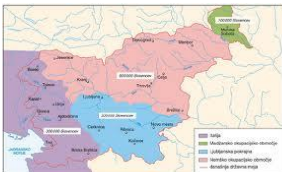
Slika 2: Razkosanje Slovenije aprila 1941

Nemci so zasedli Štajersko, Gorenjsko in Mežiško dolino, območje Dravograda, štiri vasi v Prekmurju in severni del Dolenjske, Italijani so zasedli Notranjsko, večino Dolenjske in Ljubljano, Madžari pa Prekmurje. (Razpotnik, Snoj, , 2005)