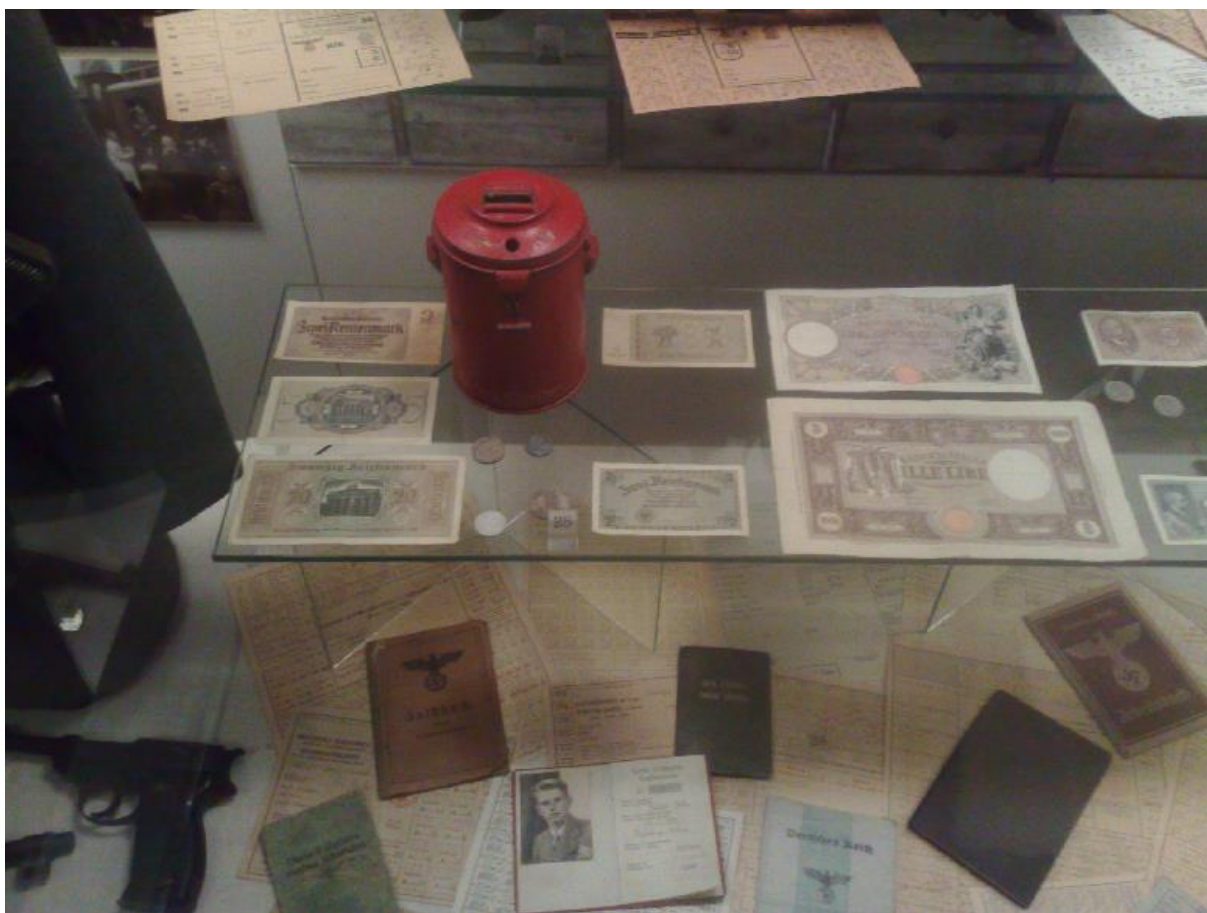
Slika 11: Nakaznice iz časa okupacije Ljubljane