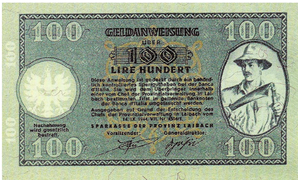
Slika 10: Bankovec za 100 lir (zgoraj s slovenskim, spodaj z nemškim napisom)