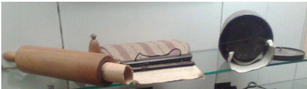
Slika 14: Pripomočki za skrivno prenašanje preko mejnih blokov

Druga svetovna vojna je močno zaznamovala tudi slovenski prostor. Na naših tleh se je začela 6. 4. 1941. Okupatorji so vkorakali na naše ozemlje, ga zasedli in si ga razdelili. Sledila je kruta raznarodovalna politika, katere končni cilj je bil izbrisati slovenstvo. V teh razmerah se je slovenski narod zelo dobro organiziral, saj se je hitro razvil upor proti okupatorju. Središče upora pa je bila Ljubljana, kjer je bila ustanovljena Osvobodilna fronta. Ta je med drugim organizirala pomoč prebivalcem, ki zaradi vojnih razmer niso mogli preživeti (Slovenska narodna pomoč). Okupatorji so skušali na različne načine zatreti njeno široko delovanje, tudi s postavitvijo žične zapore okoli Ljubljane, a niso bili uspešni. Želja ljudi po upor in preživetju je bila močnejša. Tako so v Ljubljani tiskali ponarejene nakaznice, bančna nakazila ... Na različne načine so pomagali tudi partizanom v zaledju (pošiljali so jim pomoč, ki so jo pretihotapili po kanalih ali kar mimo straž na blokih).