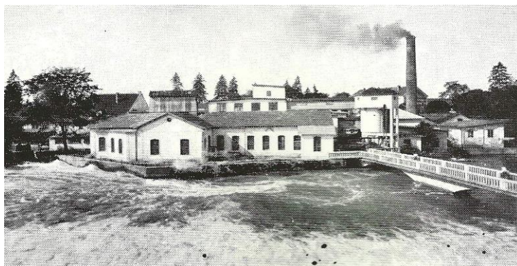
Slika 9: Vevče - obrat za izdelavo specialnih papirjev (pred vojno)