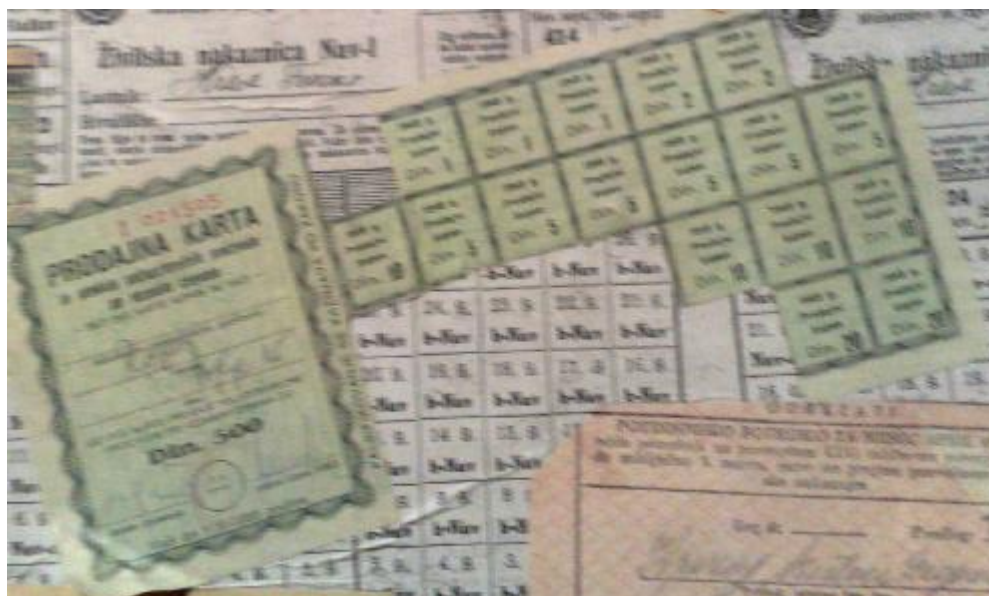
Slika 13: Povojne nakaznice

Nakaznice pa niso bile v uporabi le med vojno, ampak tudi po njej. (spodnja slika)