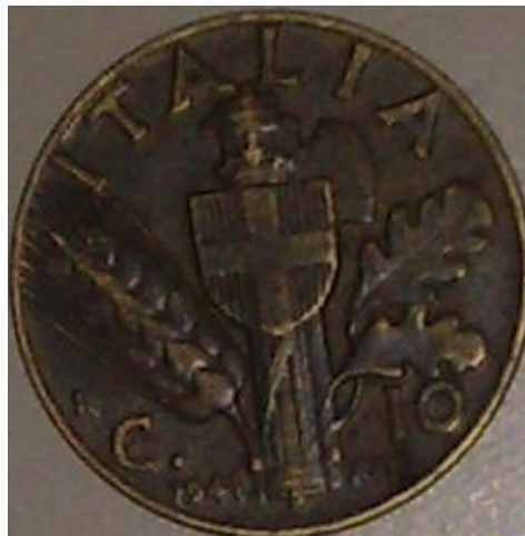
Slika 17: Italijanski kovanec z obeh strani