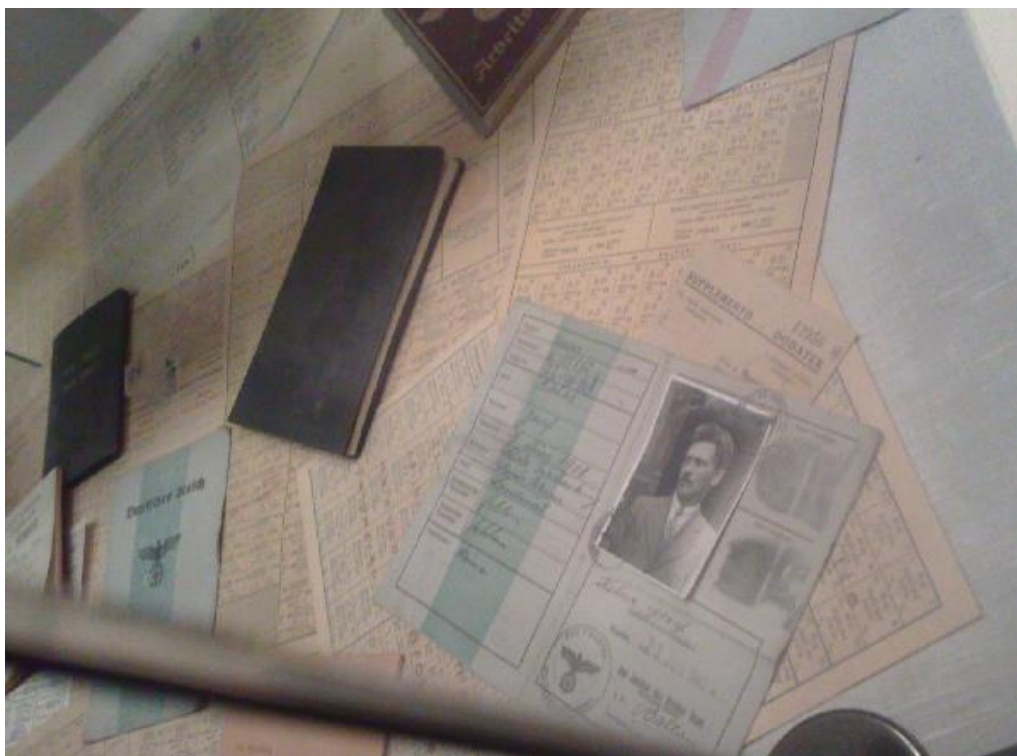
Slika 12: Nakaznice iz časa okupacije Ljubljane