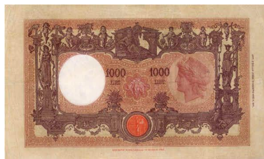
Slika 16: Bankovec za 1000 lir s sprednje in zadnje strani