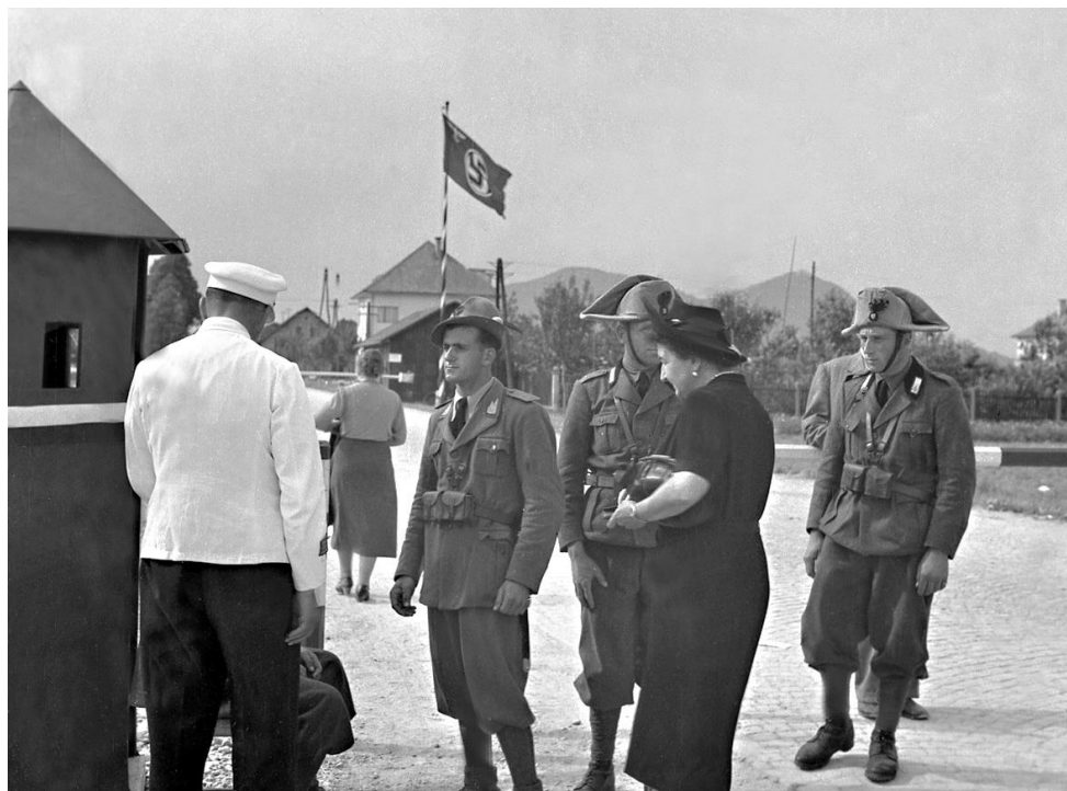
Slika 3: Mejni blok pri Šentvidu nad Ljubljano, kjer je bila tudi nemško - italijanska meja

S del ljubljanskega predmestja so zasedli Nemci. Ta del je bil za Ljubljano zelo (kmetijsko-poljedelsko) pomemben. Tako je Ljubljana ostala odrezana od naravnega zaledja. Tudi industrijski objekti so bili pod nemško okupacijo. V mestu, pod italijansko okupacijo, so ostali sedeži podjetij in denarni zavodi.