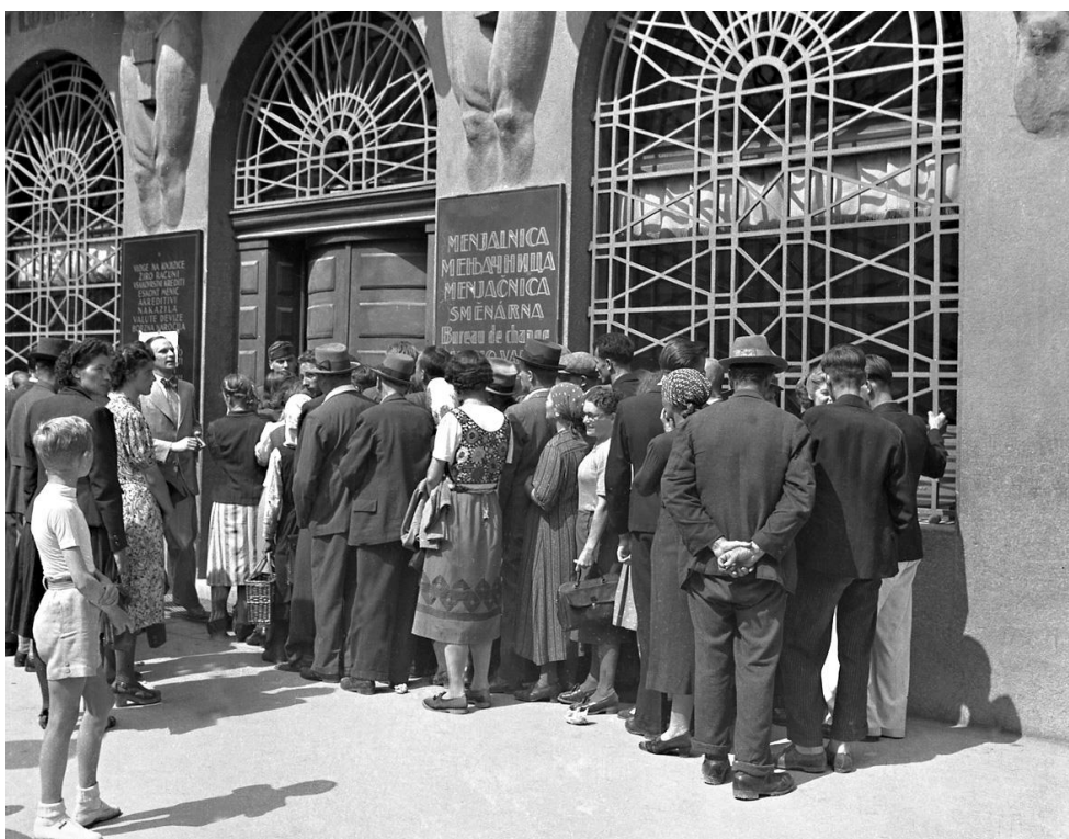
Slika 8: Vrste ob zamenjavi dinarjev v lire, junij 1941

Veliko denarja pa je ostalo tudi nezamenjanega. (Šorn, 2007)