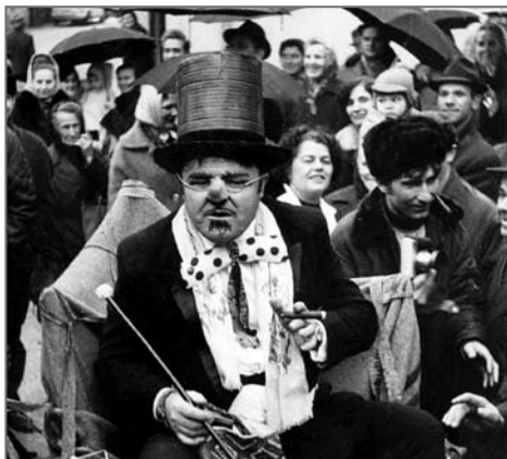
Pustni sprevod leta 1970

Mrtve so položili na »špampet« (na posteljo so položili deske, jih prekrili s črnim ali belim prtom, in nato krsto). Mrtvec je bil oblečen v zakmašno obleko, zraven krste pa so mu položili še mrtvaške copate. »Vahtarjem« so stregli s kruhom, žganjem ali moštom. Ti so prepevali žalostinke kot Kadar jaz umrla bom, venček bel nosila bom ... ali Prišla bo pomlad, čakal bi jo rad ... Prišla bo grenka smrt ... Krsto so zabili, pokadili in poškopili z blagoslovljeno vodo, preden so jo sosedje iz hiše odnesli na belsko pokopališče. Še pred letom 1940 je v pusta napravljeni z dolgo šibo preganjal otroke. Na pepelnico sredo so mrtvega pusta nosili iz tovarne na Javorniku do Dežmana in naprej k Žvabu, kjer so imeli škafe vina. V župnika napravljeni je pusta škropil z vinom in molil, ostali so ga tudi škropili in zraven pili. Na koncu so ga razžagali. Pred sto leti so ob pepelnici še žagali slamnato babo. Dekleta pa so morala bosa tekati po snegu, dokler niso dobila »rdečih čeveljčkov«.