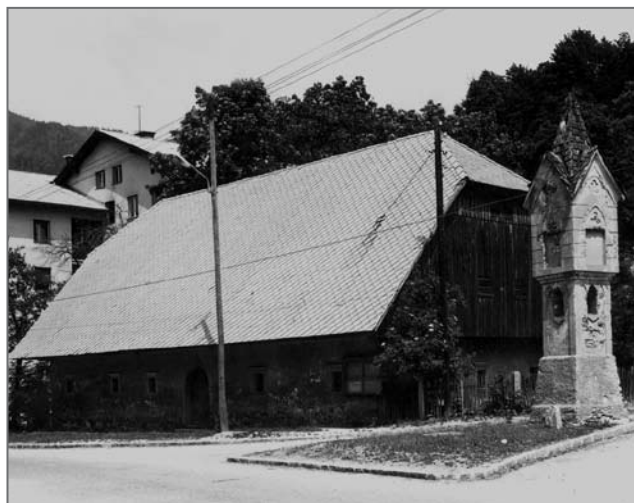
Štefančeva hiša s Francoskim znamenjem leta 1967