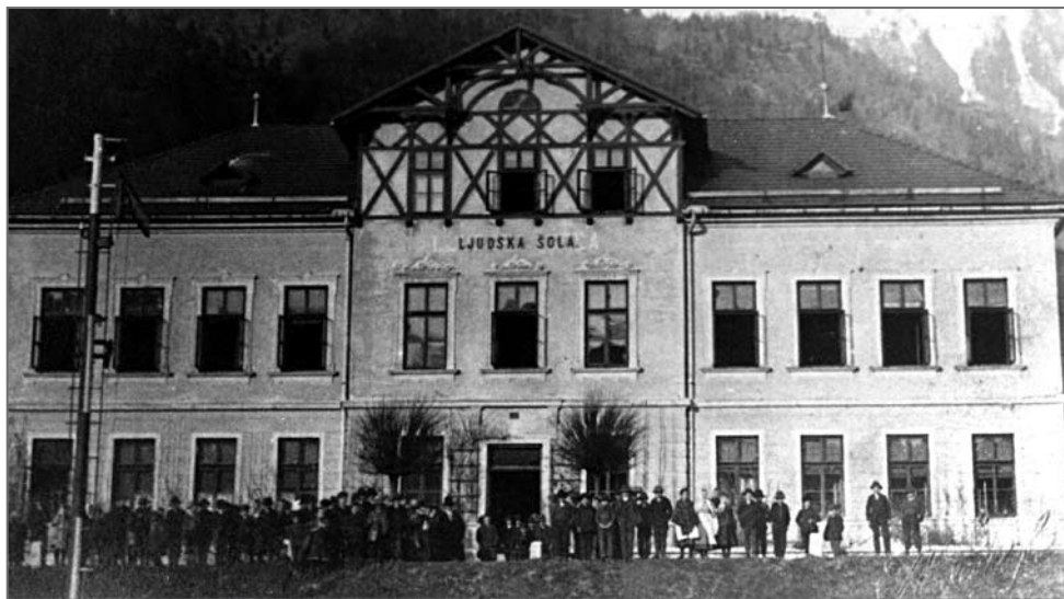
Šola na Koroški Beli leta 1904 (hrani GMJ)

Prva šola je bila zgrajena leta 1858 – najprej kot farna, od leta 1871 pa kot kot enorazredna ljudska šola. V stavbi s h. š. 85 se je poučevalo do leta 1939. Večja šestrazredna šola s petimi učilnicami ter s stanovanji za učitelja in služitelja pa je bila zgrajena leta 1903