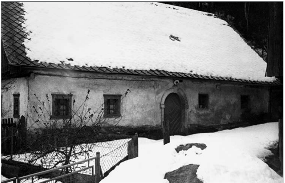
Blažunova hiša na Gorski poti 6 leta 1985