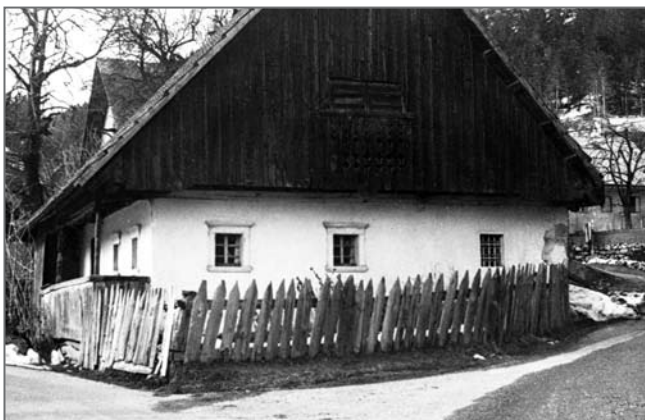
Maričnekova hiša leta 1985

nivojem tal. Revnejši so gradili pritlične hiše. Več starih hiš datira v 18. stoletje ali še v zgodnejše obdobje. Kmečki dom sestavljata vzporedni zgradbi. Domačije ograjuje plot z dvoriščnimi vrati. Gospodarsko poslopje sestavljata hlev v pritličju in skedenj v nadstropju. Le redke kašče so samostojni objekti. Stogovi so v stegnjeni ali vezani obliki. Bistveno spremembo je povzročil požar leta 1917, saj so bile v požaru uničene stavbe na novo zgrajene iz betona, lesene kritine pa so zamenjale opečnate. Tudi zgornji leseni deli hiš so bili na novo pozidani, sezidani so bili tudi novi hlevi. Kasneje je bilo le v obdobju med 1931 in 1938 zgrajenih novih 132 delavskih hiš, a povsem nenačrtno. Zaradi reševanja stanovanjske stiske je bilo tudi veliko prizidkov. Po prvi svetovni vojni so se začele uveljavljati bele kuhinje,