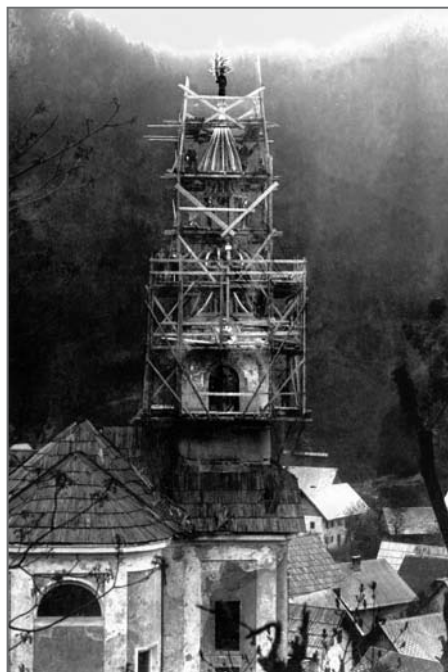
Obnova cerkvenega zvonika leta 1917

Župnija Koroška Bela se je osamosvojila že leta 1788 in odtlej spada pod radovljiško dekanijo in ljubljansko škofijo. V župnijo še danes sodijo tudi Javornik, Potoki in Javorniški Rovt. Župnijska cerkev Svetega Ingenuina in Albuina je edina posvečena tema svetnikoma. Ingenuin je vladal za časa papeža Gregorija Velikega in umrl okoli leta 600, Albuin pa je izhajal iz rodovine koroških mejnih grofov in živel 400 let kasneje, oba pa sta pokopana v briksenški stolnici. Cerkev na Koroški Beli je bila najprej podružnica radovljiške in kasneje jeseniške župnije, leta 1681 je bil tu ustanovljen beneficij, 1788 lokalija in 1875 samostojna župnija. Krstna knjiga Koroške Bele je pisana od leta 1672, mrliška pa od 1675. Stara župnijska kronika je bila