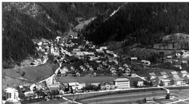
Koroška Bela iz zraka okoli 1962 (hrani GMJ)

Koroška Bela je veliko gručasto naselje, ki mu dominira vzvišena lega cerkve in se deli na vzhodni del na Vasi ter na zahodno stran grabna, po katerem teče potok Bela. Manjše kmetije so bile še na Kresu. Gruntarji so posedovali boljšo zemljo, kajžarji pa svojo v