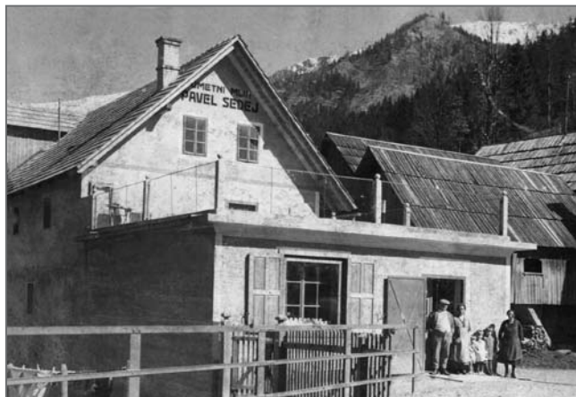
Sedejev mlin okoli leta 1940

Sedejeva mlina, spodnji do leta 1926, zgornji pa do leta 1955. Manj premožni krajani so za preživetje služili kot gozdni delavci in oglarji. Na kopiščih so ostajali od spomladi do jeseni in prebivali v oglarskih bajtah (prenosljive enocelične brunaste zgradbe). Oglarji so prenehali z delom že