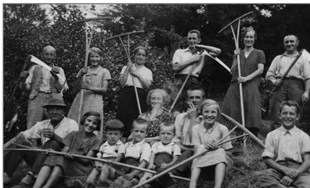
Kosci in grabljice na rovtu okoli 1940

Za poljedelstvo so bile sprva značilne kulture žit, kasneje pa še pridelava živinske krme in novih kulturnih rastlin (krompirja, koruze, fižola in ajde). Od konca 19. stoletja so z uporabo železnega pluga dosegli večjo rodovitnost polj. Žit