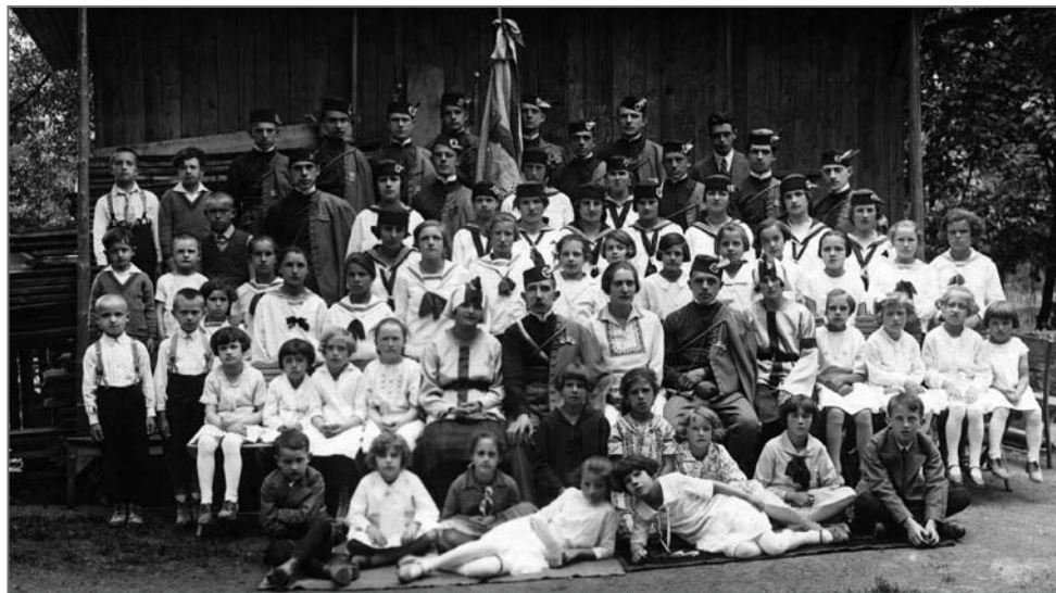
Člani Katoliškega prosvetnega društva Orel okoli leta 1920

Leta 1907 je bilo ustanovljeno Katoliško prosvetno društvo, v okviru katerega so delovali dramski odsek, tamburaški zbor in knjižnica. Z darovi župljanov je bil leta 1913 zgrajen društveni dom oziroma cerkvena hiša na h. š. 34, kjer je imelo svoje prostore tudi telovadno društvo Orel. Sedež Sokola je bil na Javorniku, kakor tudi