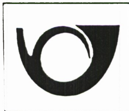
SL10. PRENOVLJENA SEDANJA POŠTNA ZGRADBA