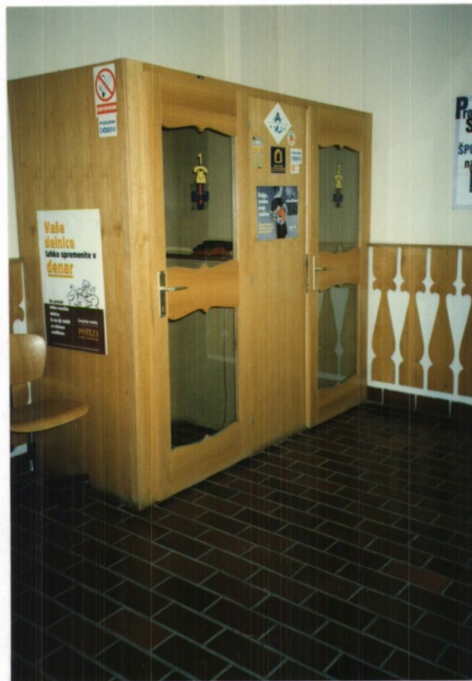
SL.12 TELEFONSKI GOVORILNICI NA POŠTI, HRANI JO GA.TONČKA JAVORNIK