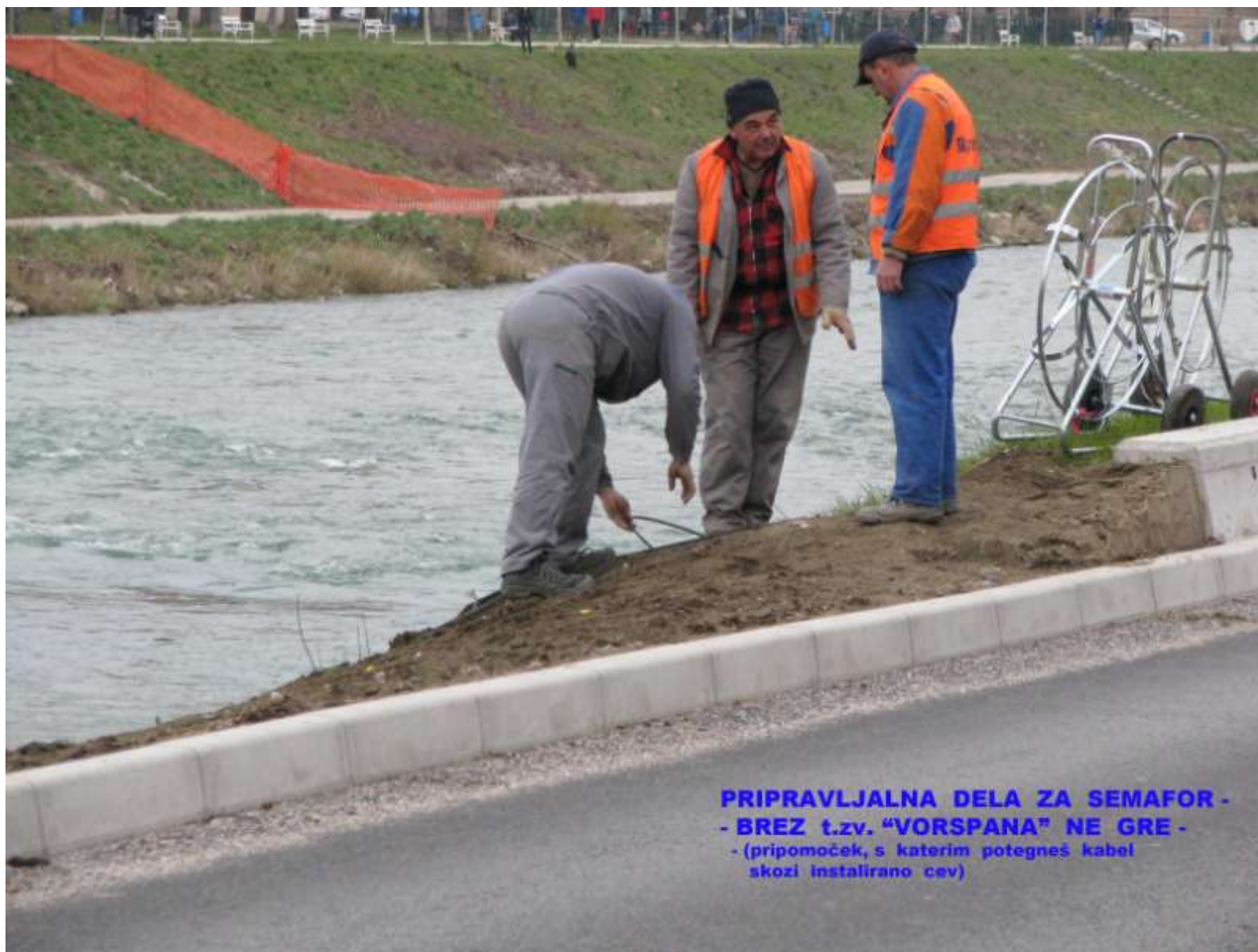
PRIPRAVLJALNA DELA ZA SEMAFOR - - BREZ t.zv. "VORSPANJA" NE GRE - - (pripomoček, s katerim potegneš kabel skozi instalirano cev)