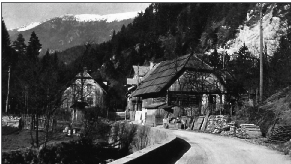
Hiša Pri Škurtniku v Trebežu na Javorniku (last Pavel Smolej)