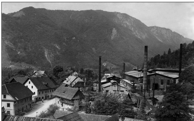
V Trebežu leta 1932