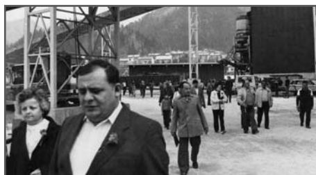
Todosja z ženo ob odprtju jeklarne 2 leta 1987

V novem stanovanju sem ostal deset let. Tam sta se nama rodila dva otroka. Po desetih letih smo se na petek, 13. decembra, leta 1985 preselili v drugo stanovanje. Zdaj sta otroka že odrasla. Odšla sta na svoje. Po štiridesetih letih dela uživam zaslužen pokojnino in srečno živim na Jesenicah, nekoč prašnih, danes pa zelenih in lepih.