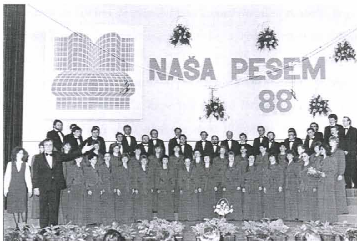
Slika 9 Naša pesem leta 1988

Če se ozremo a obdobje Goršičevega delovanja v zboru , ugotovimo, da je zbor vztrajno kakovostno rasel, seveda pa je dozoreval tudi dirigent sam. Dirigent in zbor so se sredi sedemdesetih let čutili sposobne, da so začeli študirati zahtevnejšo zborovsko literaturo in to kar uspešno. Prijavili so se na nekatera tekmovanja. Tu naj izpostavim Naša pesem v Mariboru . Sledila pa so tudi tekmovanja v tujini.