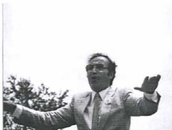
Slika 10 Stična 1988

"Sreča in nezadovoljstvo, veselje in žalost, zmage in porazi, človeška dobrotta in zloba, tovarištvo in....Vse to so sestavni deli našega vsakdana. Tudi pevskega zborovstva. Vse to sem doživel v teh 24-letih pri tem zboru. Priznam, velikokrat sem obupal, hotel vreči puško v koruzo, pa vendar še vztrajam. Zaradi čudovitih ljudi, ki se dvakrat tedensko sestanejo in prepevajo v zanikrnih prostorih na Gregorčičevi 6." (Danes je to lepa pevska soba.)