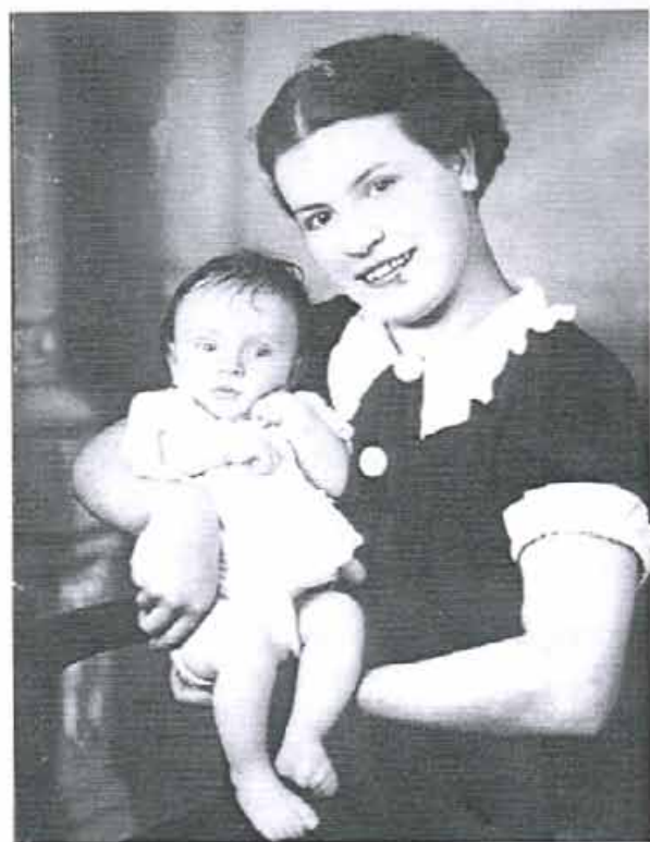
Slika 1 Slika z mamo leta 1936

Potem se je družina povečala še za brata Toneta in Janeza. Tone je znan športnik in športni pedagog. Janez je po očetu prevzel vulkanizerstvo in se ukvarjal z glasbo.