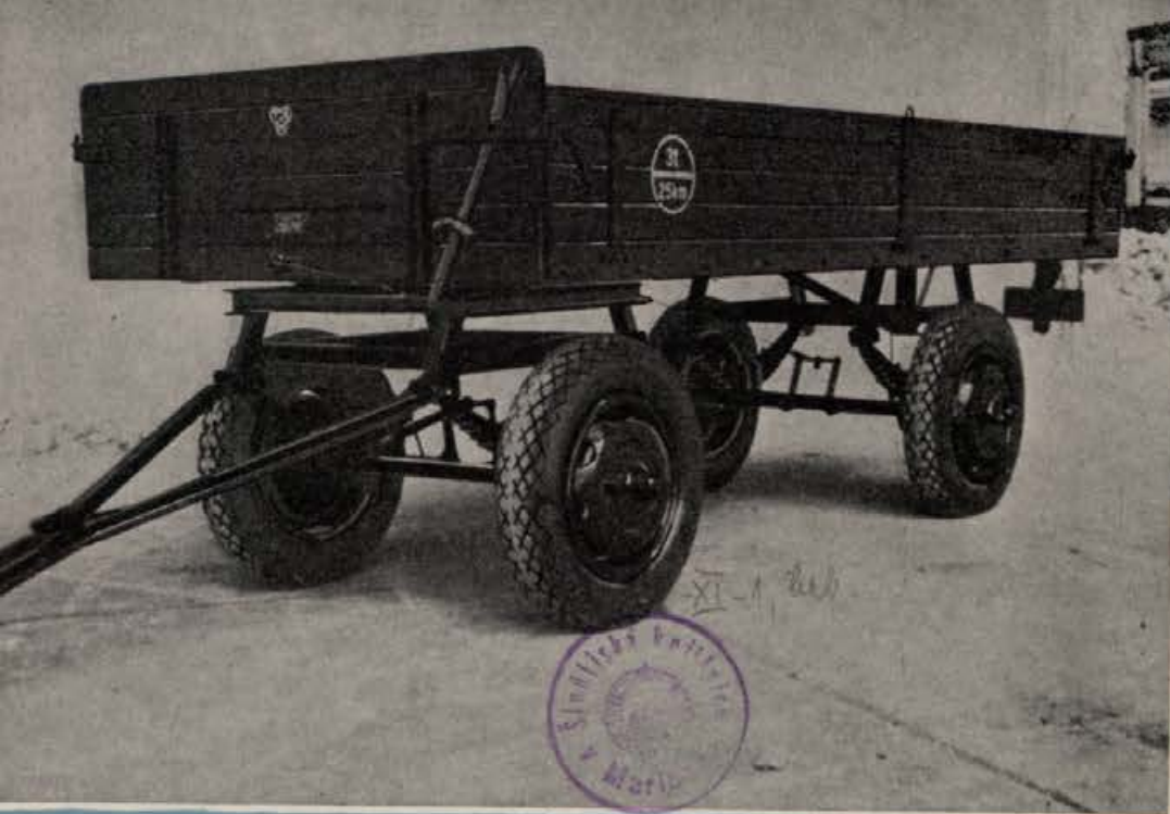
VZMETNA TRAKTORSKA PRIKOLICA VPK-3