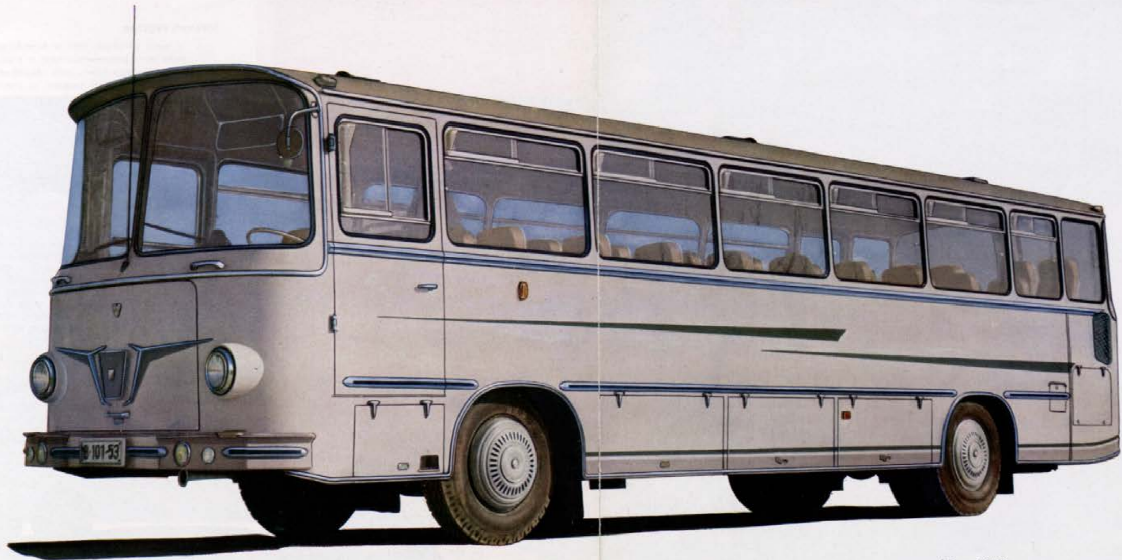
AS — 3500