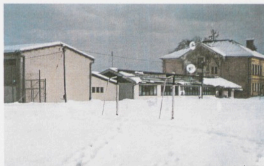
Šolsko poslopje je sestavljeno iz stare šole, nove zgradbe in moderne telovadnice. Ob šoli je tudi šolsko športno igrišče.