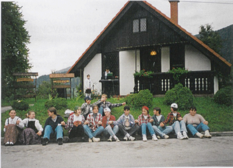
Slika 1: Manca - montažna hišica - stoji v Gornjem trgu.

Uredili smo razstavišče, ki so ga že prvi obiskovalci imenovali "mali muzej."