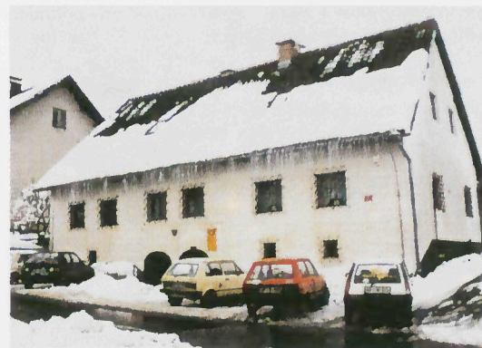
Pošta je lepa stara zgradba v centru Lovrenca. Pred nekaj leti je bila obnovljena in v njej so sedaj sodobno opremljeni poštni prostori.