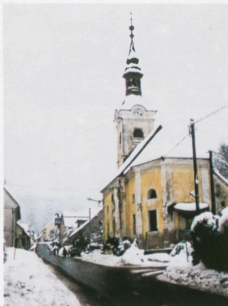
Središče Lovrenca z zgradbo krajevnih skupnosti na levi strani in cerkvijo na desni.

Ljudje so zato, da so lahko preživeli, spreminjali naravo, vendar le toliko, kolikor je bilo to nujno potrebno. Življenje tukajšnjih prebivalcev je bilo trdo in ob svojem delu ljudje niso izgubljali besed. Lovrenčani so zato še danes redkobesedni, vendar odkriti in pošteni. Že večkrat v preteklosti so ljudje pokazali ljubezen do rodne grude in tudi danes so ponosni na svoj kraj.