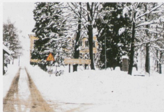
V šolskem parku v centru Lovrenca stoji spomenik padlim borcem in žrtvam druge svetovne vojne.