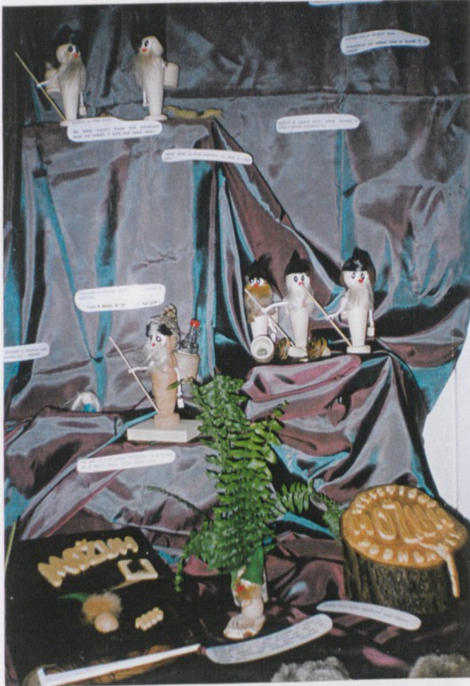
Slika 2: Beno Šumer - Možuhova družčina

Pri dodatnem potku argentinca, ki je bil v letu 1998 v Slovenijo priveden, so ga privedli tudi v argentinca. Dva dni potovanja po različnih krajih.