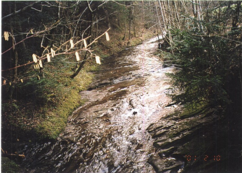
Slika 8 in 9: Slepnica je počasen in miren potok, ki teče po gladkih, kamnitih ploščah.