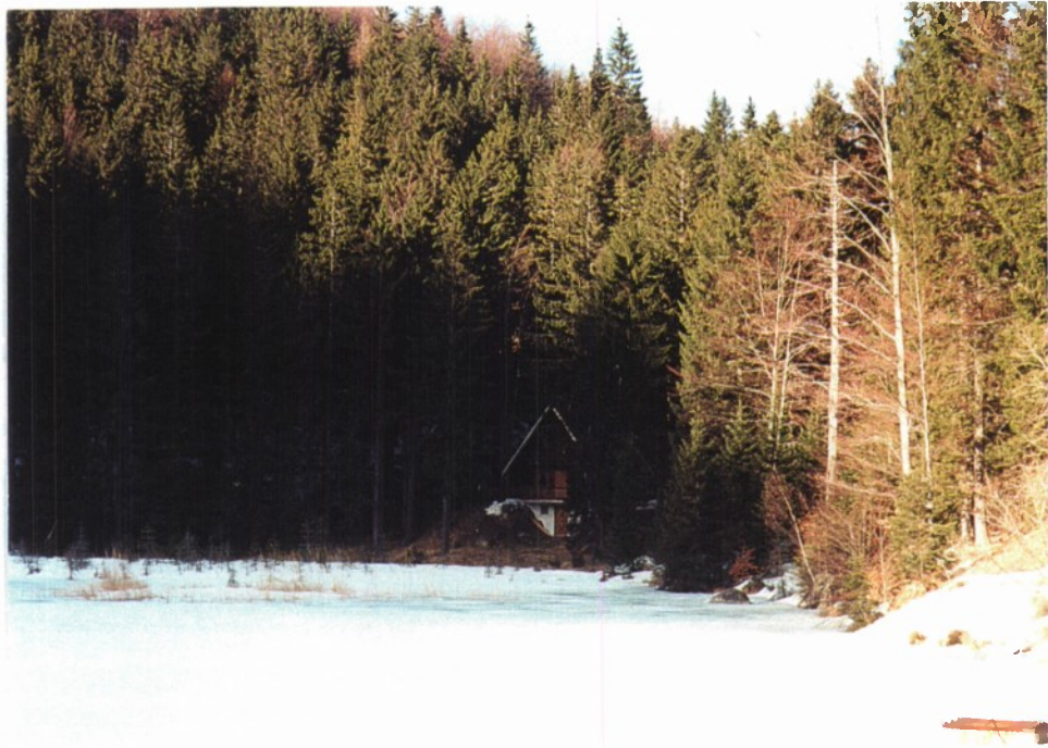
Slika 18 in 19: Jezerc pozimi in poleti.