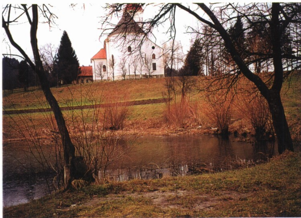
Slika 14 in 15: Juršnikov »tajht«, z lepo okolico, primerno za sprehode.

Voda v tajhtu je bila včasih zelo čista, po pripovedovanju, bi jo lahko tudi pili. Žal danes ni več tako čista.«