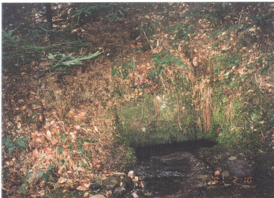
Slika 13: Marijin studenec, v gozdu pod Gaberco, z vidno skalo izpod katere izvira.