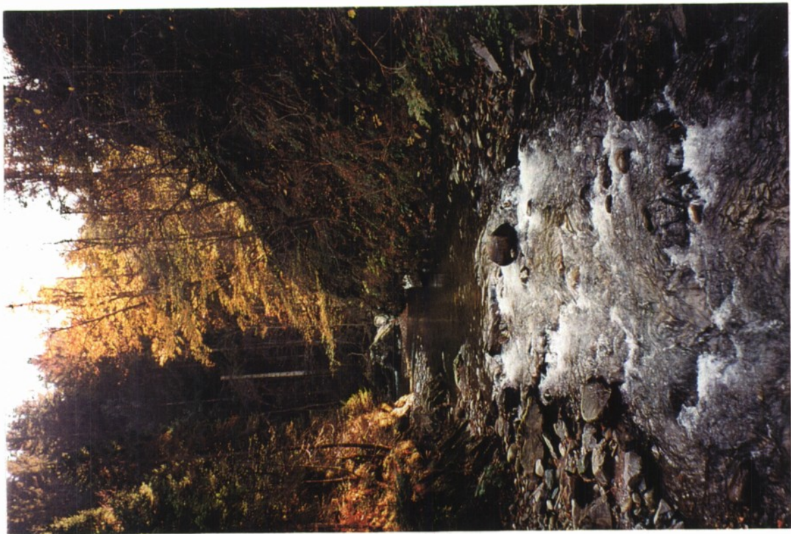
Slika 5: Radoljna v spodnjem toku, njena struga je položna.