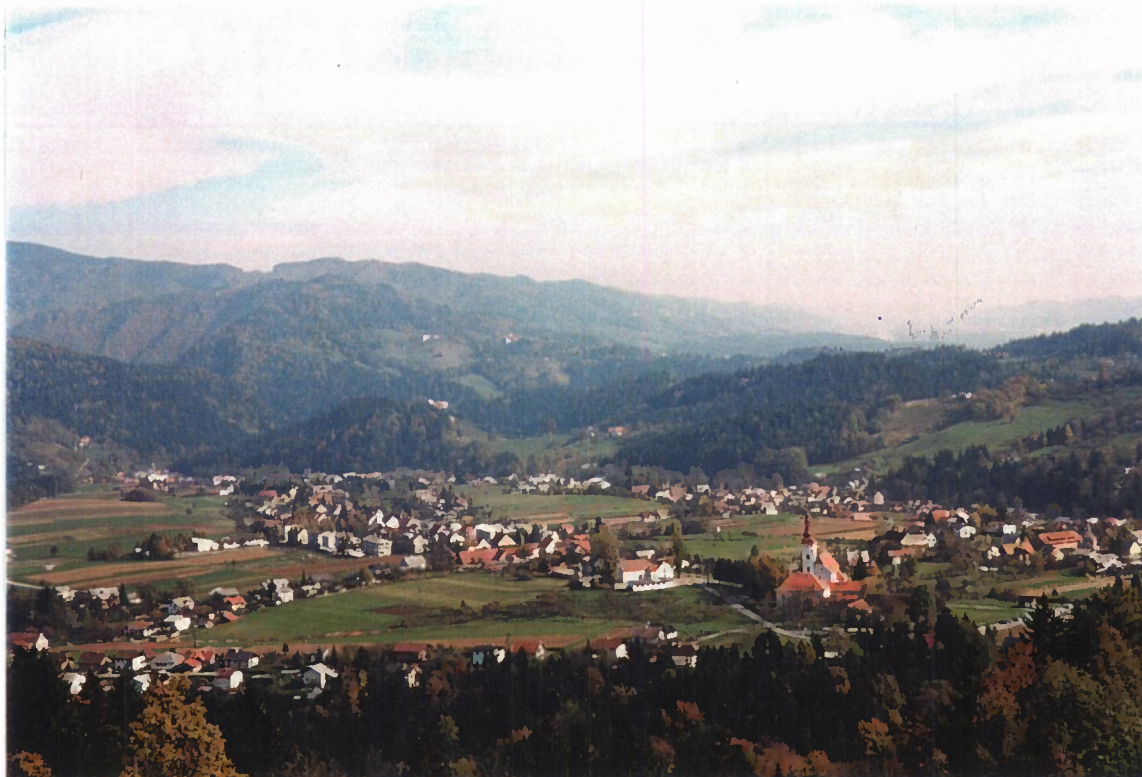
Slika 2: Lovrenc na Pohorju, slikan s Koglerjevega vrha na Rerecenjaku, v središču slike je strnjeno naselje – trg, na desni strani, ob vznožju Kumna in ob potoku Radoljne, je viden drugi del strnjenegega naselja, v ozadju je vidno hribovje Rute in celo reka Drava.