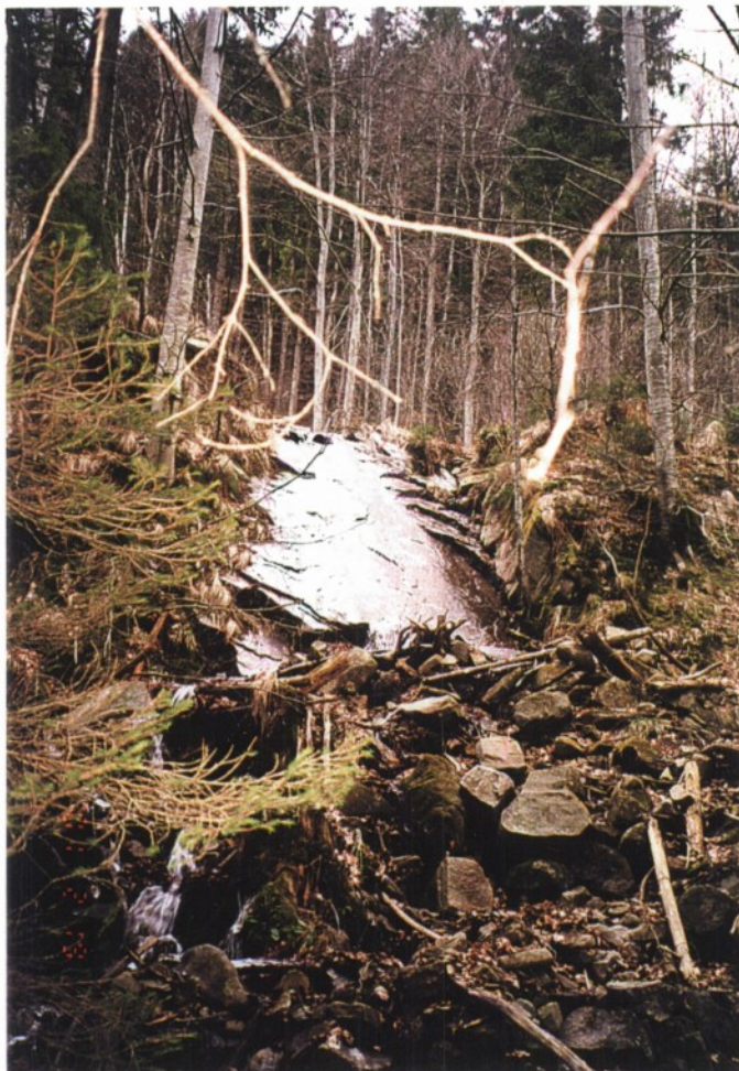
Slika 11: Velika, skalna, navpična, gladka plošča, po kateri teče voda.

Po naključju smo odkrili to naravno posebnost. Bili smo v zadregi, kako to poimenovati, saj ni slap. Tu je velika, gladka skalna plošča, skoraj navpična, dolga okoli 8 m, široka približno 4 m. Po njej se spušča voda. To je na desnem hudourniškem pritoku Radoljne, v njenem zgornjem toku.