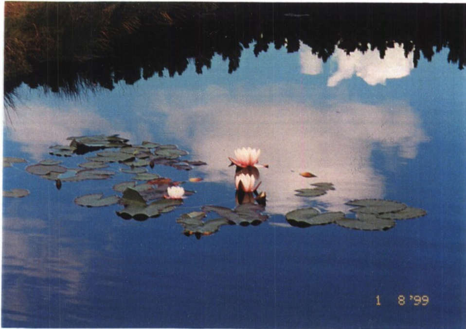
Slika 17: Na Lovrenških jezerih cveti poleti tudi lokvanj.