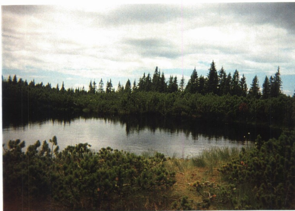
Slika 16: Eno izmed Lovrenških jezer, ki je skrito med ruševjem.

Na planoti živi tudi mnogo zanimivih živali: ruševcec, planinski zajec, alpski pupek, kačji pastir.