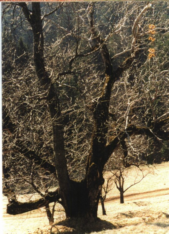
Slika 25 in 26: Oreh in češnja.