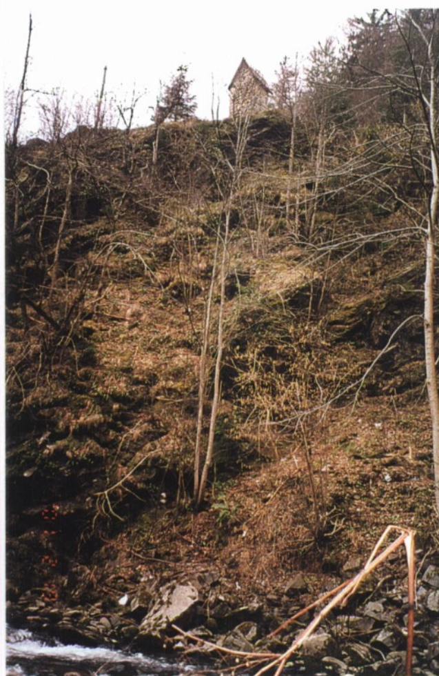
Slika 6 in 7: Soteska Vrata, videno zelo strmo pobočje, tudi skalnato.