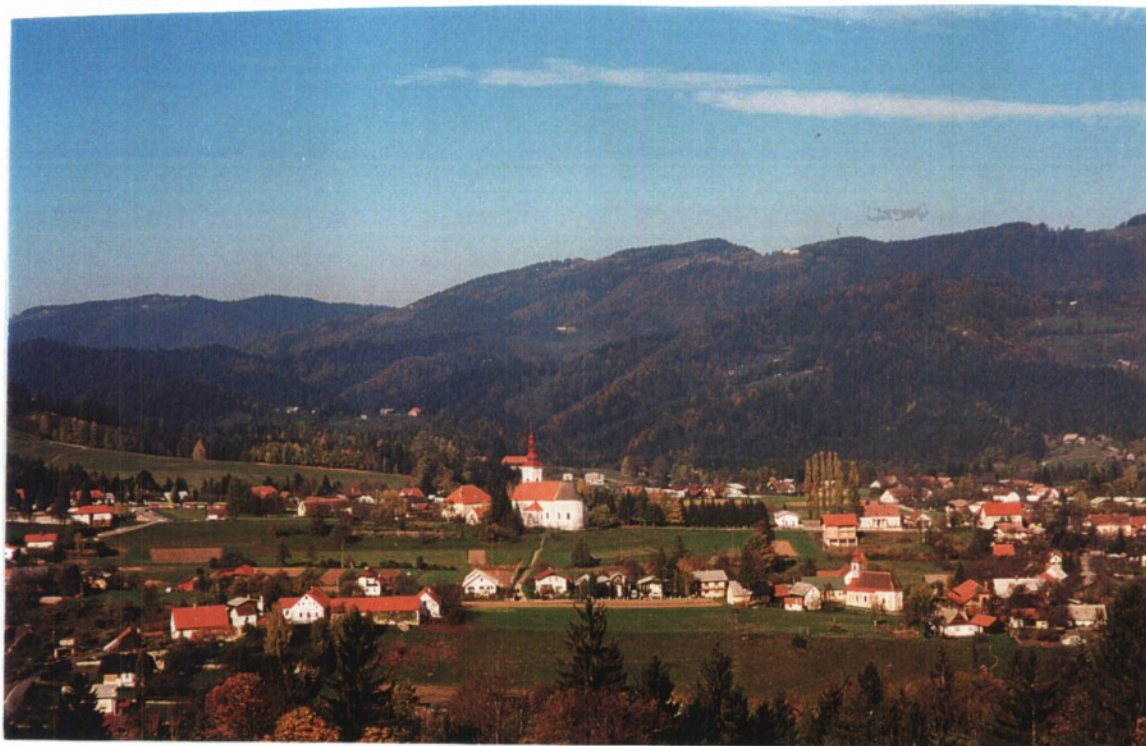
Slika 1: Lovrenc na Pohorju, slikan s Kumna, v ozadju je Rdeči breg.

Na severu loči naselje Lovrenc od reke Drave hribovje Rdečega brega, na vzhodu je hribovje Kumen, zahodni rob meji na Recenjaki, vse do Lovrenških jezer, z nadmorsko višino 1521 m, ki je tudi južna meja Lovrenca. Lovrenc ima izredno lepo naravno lego. Pogled na kotlino, s kateregakoli hriba, je čudovit in enkraten, posebno še v različnih letnih časih.