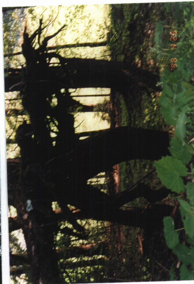
Slika 23 in 24: Bor na Ruti, vidne so tudi korenine.