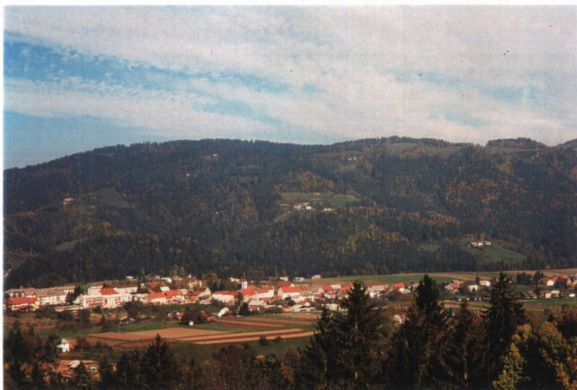
Slika 3: Strnjeno naselje v okolici šole, v ozadju se lepo vidijo posamezne kmetije na Rdečem bregu.