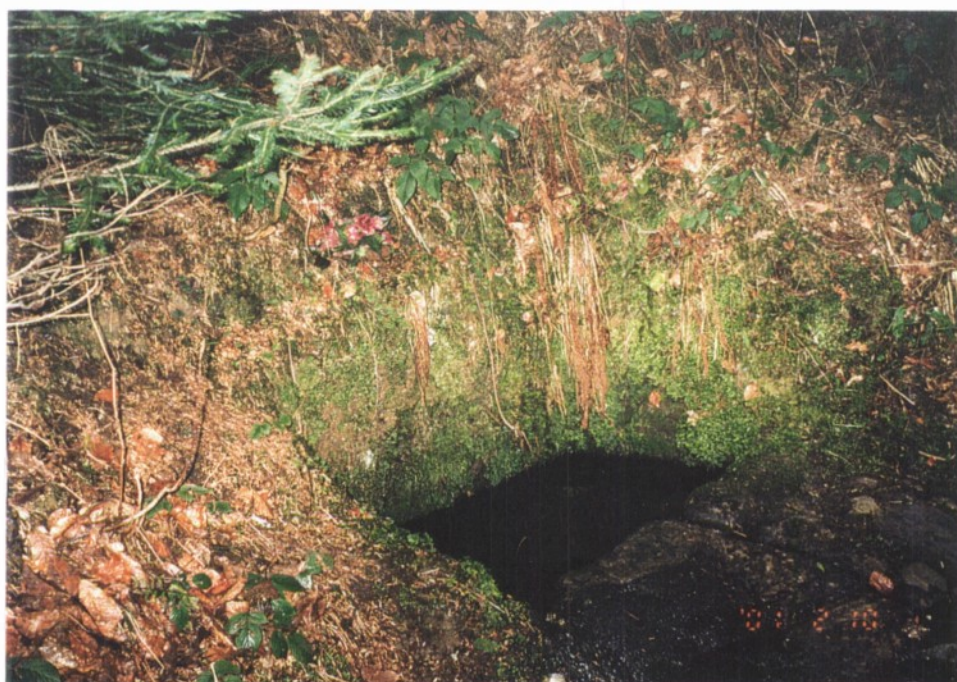
Slika 12: Marijin studenec, z lepo vidno pravokotno obliko izvira.

»Bila je huda zima, pred davnimi, davnimi časi, ko je po naših krajih hodila Marija. Rada bi oprala plenice in ni imela vode. Naenkrat je izpod skale pritekla voda in Marija je lahko oprala. Voda ni bila mrzla, ker Marijo ni zazeblo v roke. Pravijo, da je voda žegnana. Od takrat ima ta izvir, pod Gaberco, ime Marijin studenec. Vidne so Marijine stopinje. Studenec ima zdravilno moč, saj so včasih ljudje hodili tja po vodo in jo pili, si v njej namakali roke in boleče noge. V vročih poletnih dneh je voda prijetno hladna. Otroci so nosili to vodo ženicam na njive, da so se odžejale.«