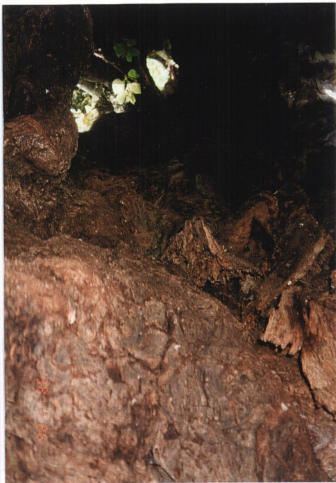
Slika 20 in 21: Pavlakova lipa z votlino.