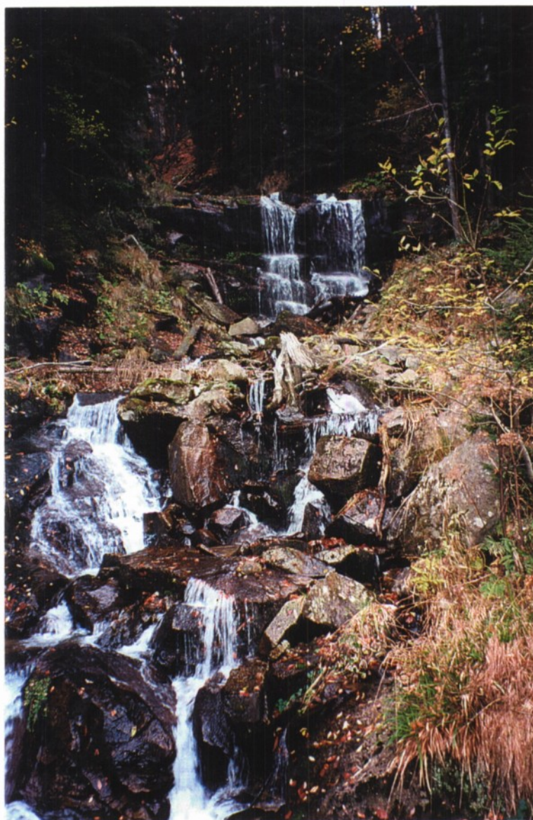
Slika 10: Skalne kaskade in slapovi na potoku Potok.

Potok, z imenom Potok, je levi pritok potoka Radoljne, v njenem zgornjem toku. Takoj pod Jezercem, je ob cesti Jezerc – Lovrenc, viden lep slap. To je hudourniški potok, ki dere preko skalnih kaskad. Potok v zimskih mesecih zamrzne in se pokaže v vsej svoji lepoti. V deževnih poletnih dneh voda v potoku naraste in slap je še mogočnejši. Slap je visok od 5–8 metrov, ker je skalna polica, čez katero teče, poševna.