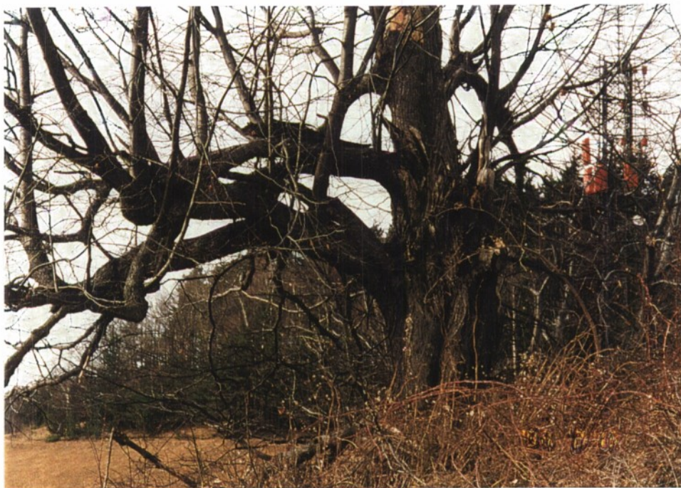
Slika 22: Stoletna lipa

To drevo raste na Rdečem bregu, na nadmorski višini 750 metrov. Lovrenčani jo poznamo po imenu Stoletna lipa. Tudi najstarejši krajanji jo poznajo pod tem imenom. Nihče natančno ne ve, koliko je ta lipa stara. Obseg njenega debla je 380 cm, voka je okoli 18 m. Ima 11 vrhov, prvotno je imela le dva, ki ju je poškodovala strela. Okoli lipe raste 16 mladih lip, več jih je na severni strani. Nam se je zdela zanimiva zaradi njenega imena, njene izredne lege, od koder je prekrasen pogled na Lovrenc.