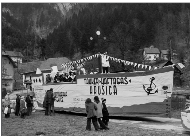
Tanker Naftagas Hrušica (Last J. Palčič)

Tanker, poimenovan »Naftagas« Hrušica, s katerim so izdelovalci opozarjali na pomanjkanje naftnih derivatov, je bil izdelan leta 1974. Gradnja sedemnajst metrov dolge ladje je potekala najprej pred kulturnim domom, nato pa so jo zaradi velikosti ladje nadaljevali na dvorišču pred Dolžanovo hišo. Po pripovedovanju je bilo tisto zimo lepo vreme in so dela lahko potekala zunaj.