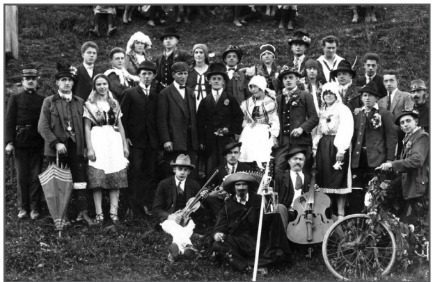
Vaška veselica okoli leta 1930 (Last Justin Černe)

Prebivalci Hrušice so večinoma ali pa kar vsi priseljeni. Prvi prebivalci so bili iz časov, ko se je delila grofovsko posest. Drugi val priseljencev je bil verjetno po odhodu Napoleona, in to so naši predniki. Prvi priseljenci so bili Rogarji (Kobentar), Kureji (Branc), Čuši (Mrvica), Robiči (Kavalar). Preživljali so se s poljedelstvom. Orali in sejali so na obdelovalni zemlji. Družine posestnikov so bile zaposlene doma in so se z obdelovanjem zemlje preživljale. Niso pa samo delali in garali, ampak so tudi plesali. V večini hiš je bila doma »frajtonarca«. Med tednom so delali, ob nedeljah pa so se zabavali. Vsako soboto so pospravili in počistili vas, zlasti skednje (senike) in v njih pripravili plese. To je bilo v tistih davnih časih edino kulturno življenje. Strankarske dejavnosti niso poznali. Bili so