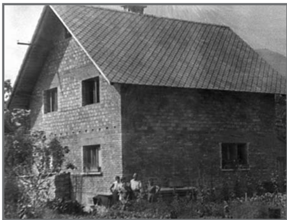
Nova Jelovčanova hiša leta 1955 (Štefi Muhar)

Vse hiše na Lipcah so pred vojno in v zgodnjih petdesetih gradili na podoben način: brez kreditov, brez mehanizacije, daleč od razkošja, z ogromno volje, odpovedovanja in pridnosti, včasih s pomočjo sorodnikov in sosedov, če so se le lahko odtrgali od svojih del. Pri skladanju opeke ali pokrivanju strehe niso nikoli zatajili. Solidarnost med sosedi je bila velika, kot otroku pa mi je bilo zelo čudno takrat, ko me je oče poslal k enemu od sosedov po žlico kleja. Dobila sem jo, pa ne zastonj, ampak za 50 din. Starša sta bila zelo razočarana. Ob takih priložnostih sem večkrat slišala pripombo: »Nič ne bo s sabo nesel!«