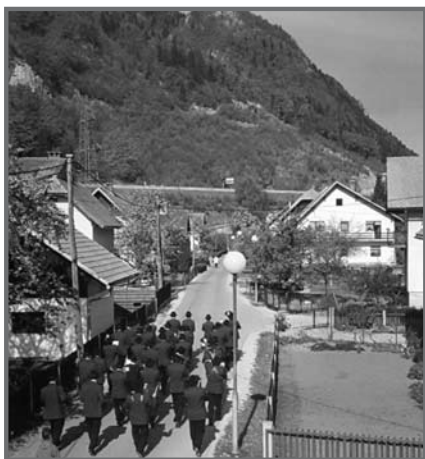
Prvomajska budnica na Lipcah okoli leta 2000 (Štefi Muhar)

Še ena tradicija že začenja združevati Lipčane: Prvomajska budnica jeseniške godbe je na Lipcah dobila domovinsko pravico. Teden prej steče nabirka, nekaj primaknejo v organih krajevne skupnosti, pa pridne roke gospodinj in 1. maja zjutraj je tu vedno veselo. Koncert godbe je, kot se »šika«, včasih se celo zapleše in ko že dolgo ni več godbe, Lipčani radi pomodrujejo in spijejo kozarček za zdravje. Zadnje čase prihaja celo mladina.