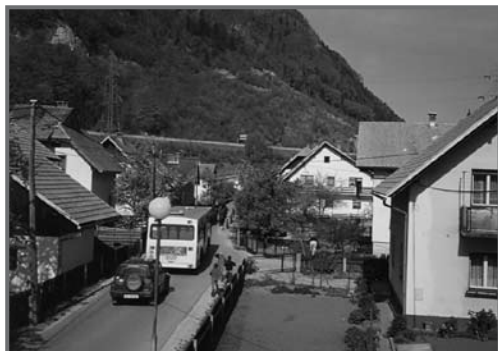
Pogled na cesto skozi Lipce danes (Štefi Muhar)

Mladina je delovna, veliko je študira. Vpetaje v krajevno življenje. Ljudje niso zaposleni kot pred desetletji pretežno v železarni, veliko je samozaposlenih, ki kot obrtniki ali v lastnih podjetjih uresničujejo svoje interese. Prvi graditelji Lipc so žal večinoma pokojni, nekaj jih še uživa zasluženi pokoj. In ti bi verjetno povedali še marsikaj zanimivega o naši vasi nad Savo. Obetajo se ji boljši časi, kot zagotavljajo odgovorni. Upajmo, da za vse, saj čas, ki ga živimo danes, ni lahek in ne lep.