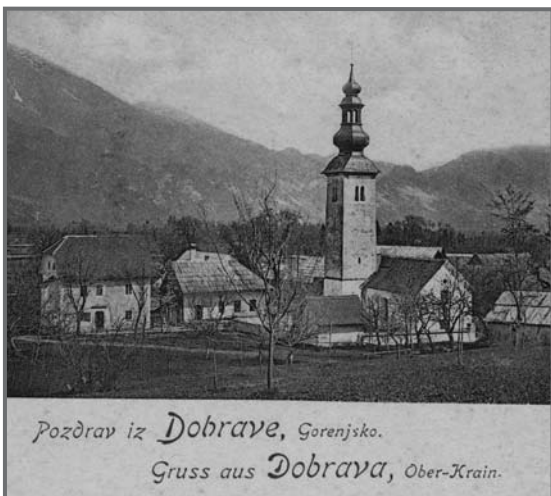
Iz razglednice Frana Pavlina pred letom 1900 (Sonja Bric)

Nasproti naše hiše je bila velika stavba v lasti jeseniške tovarne, kjer je živelo 13 družin tovarniških delavcev. V tej hiši je bila tudi prva pošta na vasi. Vodja pošte je bil Hribar, ki je dodatno služil s popraviljanjem čevljev. Nasproti