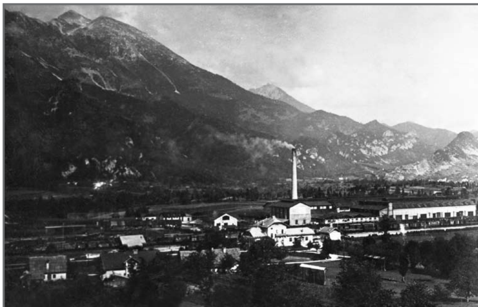
Tovarna elektrod na Blejski Dobravi je obratovala od leta 1917 do konca leta 1936.