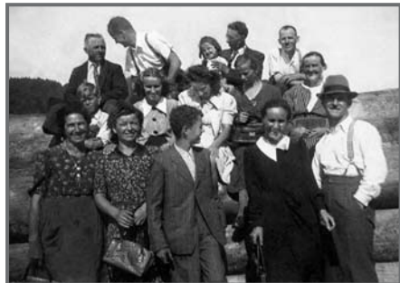
Stanovalci Zajčeve hiše na izletu v Bohinju leta 1938 (Sonja Bric)