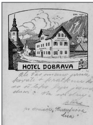
Razglednica z motivom Blejske Dobrave in hotela Kamenšek pred letom 1900 (Sonja Bric)

Naša družina je stanovala v drugem nadstropju, kjer je bil strop zaradi strehe znižan. Pod njim sta bili dve manjši okni in na drugi, vzhodni steni, še dve večji okni. Zaradi vseh oken in vrat tako ni bilo možno ob stene postaviti mize, omare ali drugega večjega kosa pohištva. V kotu kuhinje je stal železen štedilnik na visokih nogah z vratci za nalaganje drv ob strani. Zgoraj na plošči so dve odprtini pokrivali po trije »rinčki«, da so jih pri kuhanju lahko odmikali. Na drugi strani je imel štedilnik še pečico in kotliček s pipico za gretje vode (predhodnik bojlerja). Štedilnik je služil za kuhanje hrane ljudem in živalim, kuhanje perila, peko kruha in peciva ter sušenju sadja in perila. V kuhinji smo imeli jedilnico, pralnico, kopalnico, se učili, pisali naloge ... Soba je bila zelo majhna. V njej je stala verjetno še kot hotelska zapuščina lepa, visoka železna peč. Ker ni bila nikoli zakurjena, je bila le v napoto.