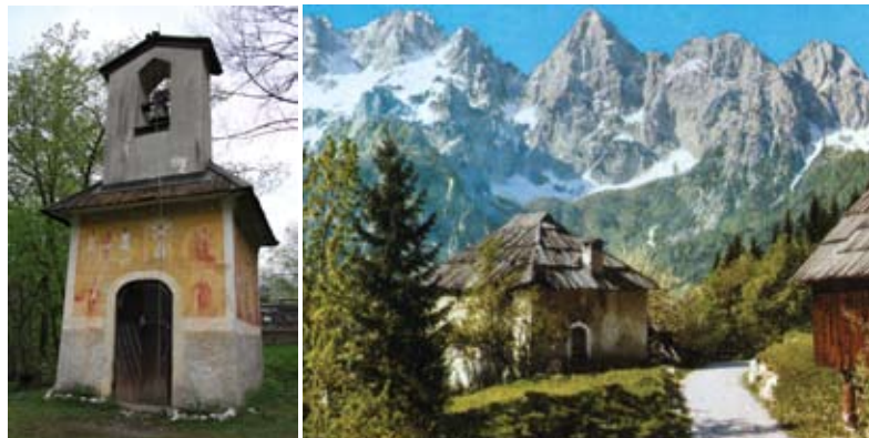
Hlebanjeva kapelica in Bukovje