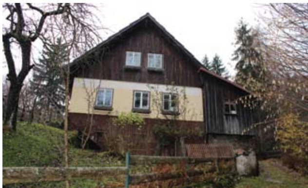
Vidičeva hiša