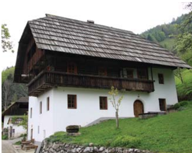
Hlebanjeva domačija

Domačija ima senožeti od Voma do Lemovnika s hlevi za seno in drobnico, senožetne planine v Hudih hlevih ter visoki planini v Žlebnicah in Za Lepim vrhom.