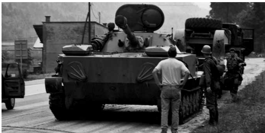
JLA na Hrušici, 27. junij 1991.